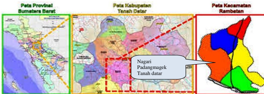
Gambar 1: Peta Nagari Padangmagak Tanah Datar Sumatera Barat

Dalam pelaksanaan pengolahan tanah dengan sistem bagi hasil ini terjadi hubungan sosial antara petani pengarap lahan dengan pemilik lahan (perantau). Untuk mengkaji hal tersebut, maka tidak terlepas dari struktur sosial yang terdapat dalam masyarakat. Struktur sosial yang dijelaskan oleh Suparlan (Suparlan, 1989) sebagai pola hak dan kewajiban para pelaku dalam suatu sistem interaksi yang terwujud dalam rangkaian hubungan sosial yang relatif stabil dalam jangka waktu tertentu berdasarkan status dan peranannya. Secara nyatanya kedudukan perantau sebagai pemilik lahan/tanah akan kuat, dan hubungannya dengan petani pengarap akan terlihat seperti sebuah hubungan patron-klien (Scot, 1994).