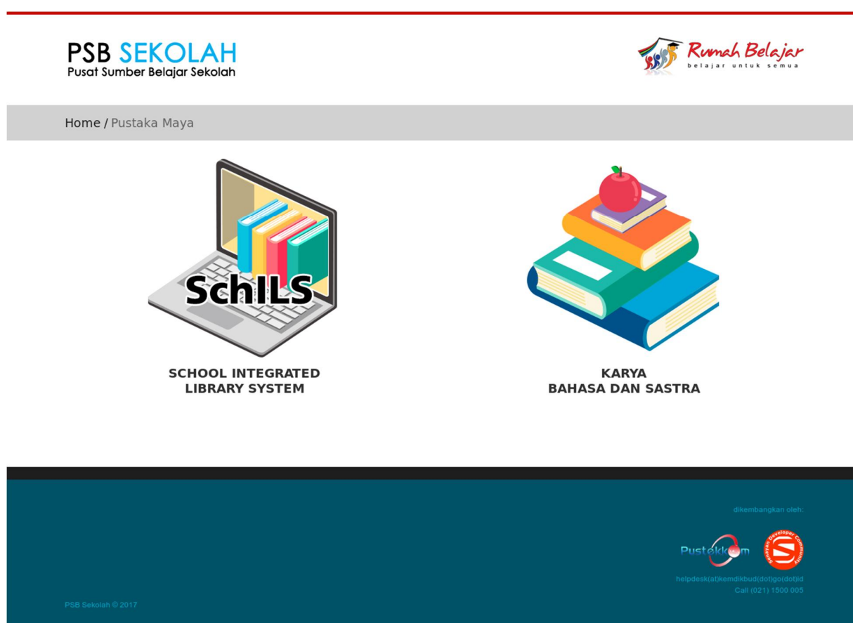
Gambar 2. Laman untuk memulai akses SchILS.

pada tautan tersebut, maka pengguna akan dibawa ke halaman berikut.