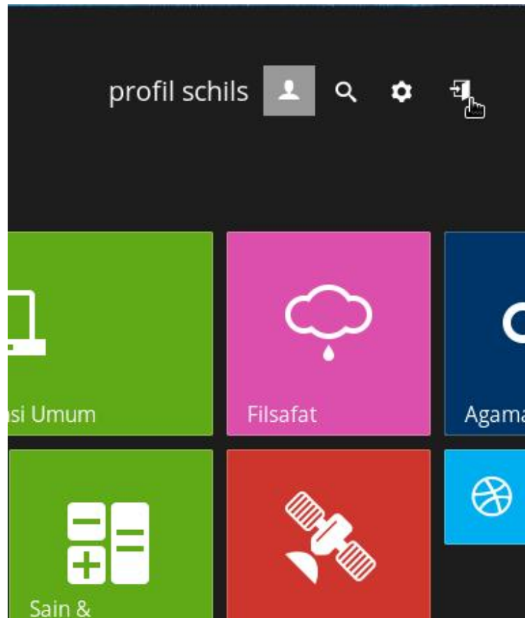
Gambar 4. Tautan akses ke laman pustakawan/pengelola perpustakaan

Untuk mengakses antarmuka ini, pustakawan/pengelola perpustakaan dapat melakukan klik pada ikon pintu terbuka seperti yang dicontohkan pada gambar berikut.