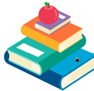
KARYA BAHASA DAN SASTRA