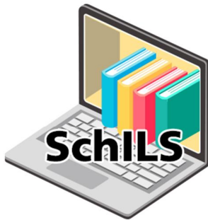
SCHOOL INTEGRATED LIBRARY SYSTEM