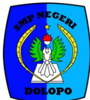
SMP NEGERI 1 DOLOPO