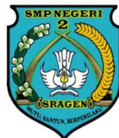
SMP NEGERI 2 SRAGEN