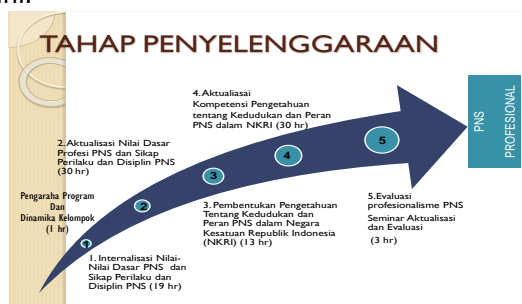
Bagan tahapan Diklat

Untuk mengawal proses aktualisasi nilai-nilai dasar PNS maka dilakukan coaching pembimbingan peserta baik secara tatap muka maupun dengan menggunakan media komunikasi yaitu telepon, email, whatsapp. Secara keseluruhan tahapan diklat prajabatan golongan III dapat dilihat pada bagan berikut ini.