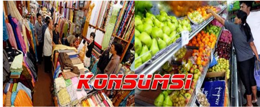
Gb 1.3 Konsumsi