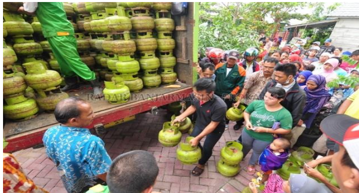
Gb1.2 Distribusi Gas Elpiji