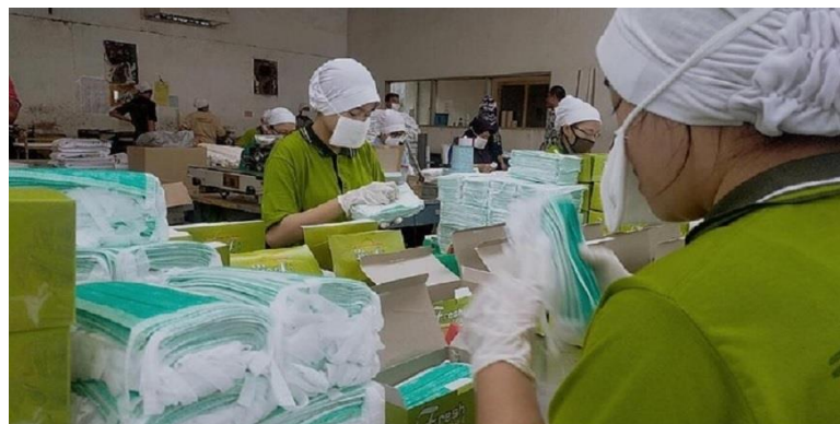
Gb 1.1 Produksi Masker

Bagaimana memproduksi barang dan jasa yang dibutuhkan oleh orang banyak, menggunakan tenaga kerja, dan bagaimana cara memproduksi barang dan jasa tersebut sehingga bisa memenuhi kebutuhan semua masyarakat.