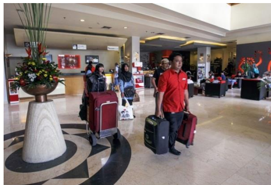
Gambar 1.1 Contoh perusahaan jasa

Perhatikan lingkungan sekitar anda, adakah perusahaan jasa? Salah satu contoh perusahaan jasa adalah hotel. Dalam melakukan kegiatan operasional, hotel akan mencatat segala transaksi ekonomi secara kronologis dan historis. Setiap transaksi yang berkaitan dengan perusahaan jasa dicatat sebagai bukti transaksi. Bukti transaksi inilah yang menjadi data pencatatan akuntansi bagi perusahaan. Selanjutnya, bukti transaksi dianalisis untuk mengetahui kondisi keuangan perusahaan dalam satu periode akuntansi.