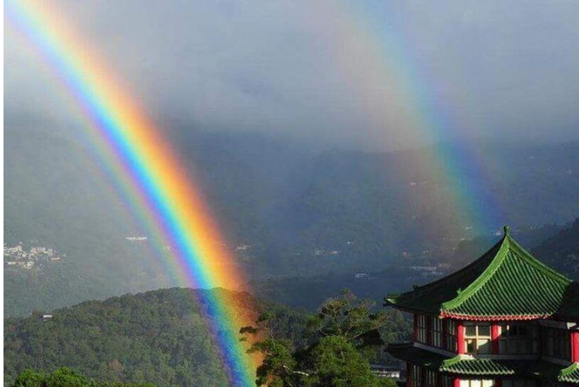
Gambar 2. Fenomena Pelangi

Pernahkah kalian melihat pelangi seperti pada gambar di bawah ini?