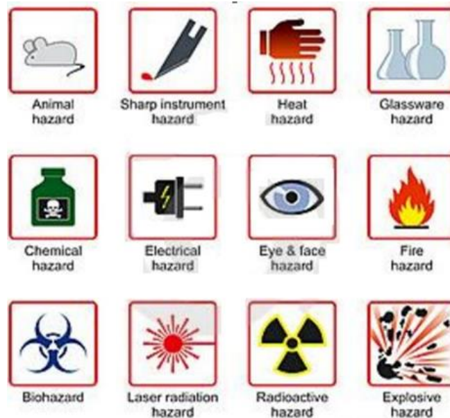
Gambar 3. Simbol peringatan

Simbol ini harus diperhatikan dan dipahami supaya kalian mengetahui bahaya yang ada pada suatu benda atau zat kimia.