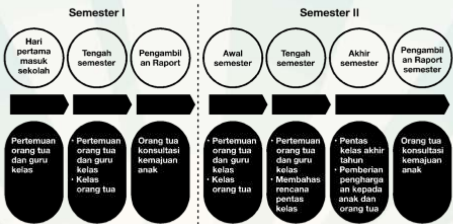
Gambar Rencana Pertemuan Orang tua dengan Wali kelas

Wali kelas berperan penting dalam menjalin kemitraan dengan orang tua/wali murid. Pertemuan guru kelas dengan orang tua/wali murid dilaksanakan minimal 2 kali per semester atau 4 kali dalam 1 tahun ajaran, yakni: (1) pada hari pertama masuk sekolah di bulan Juli; (2) Pertengahan Semester I bulan September; (3) Pertengahan Semester II bulan Maret; dan (4) Akhir Semester 2 bulan Juni. Tahapan pertemuan tersebut dijelaskan sebagai berikut: