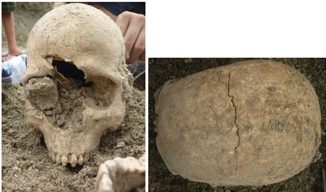
Gambar 4. Individu Leran 1