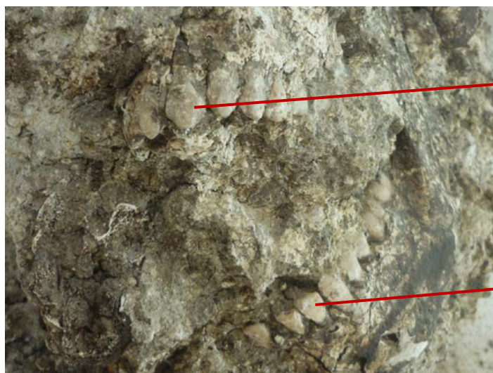
Peruncingan permukaan labial 4 gigi maksila

modifikasi gigi seperti itu saat ini dapat dijumpai pada kelompok etnis Mentawai, Sumatera.