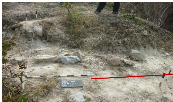
Sebaran sisa Rangka manusia

pada gigi individu Binangun. Ada aktifitas pangur kerokan pada permukaan labial gigi atas I1-I2 kiri kanan atas. Keempat gigi tersebut juga masih diruncingkan (lihat gambar 2). “Kerokan” tidak dijumpai pada permukaan lingual. Pada geligi rahang bawah ada indikasi kerokan pada permukaan labial. Namun tidak ada praktik peruncingan. Pola peruncingan ini dapat dijumpai pada populasi paleometalik dari Semawang (Bali). Kebiasaan