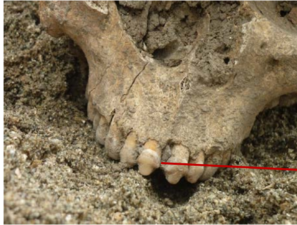
Gambar 5. Modifikasi gigi pada individu Leran 1

dilakukan oleh individu Binangun (peruncingan), individu Leran 1 mempraktikkan jenis modifikasi gigi dengan mengasah atau mengikir gigi