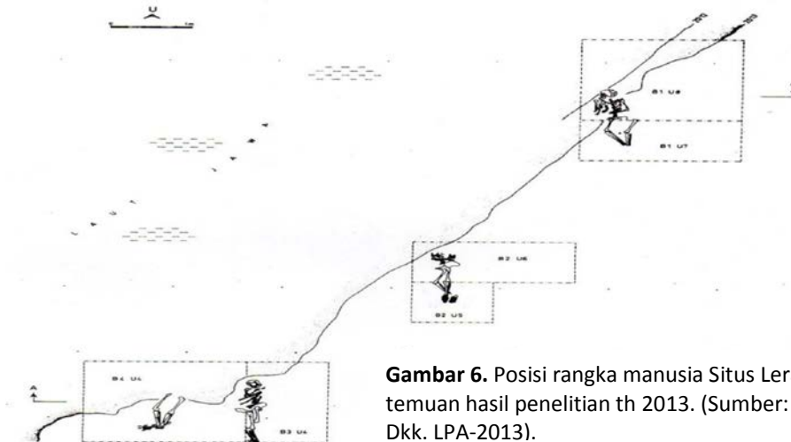
Gambar 6. Posisi rangka manusia Situs Leran, temuan hasil penelitian th 2013.