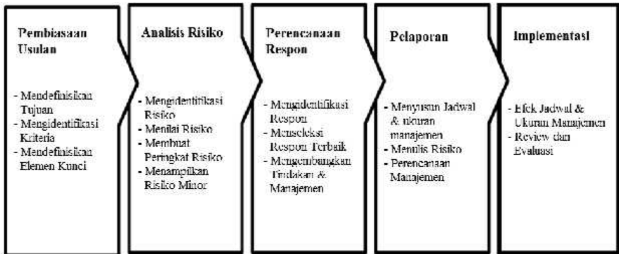
Gambar Proses manajemen risiko