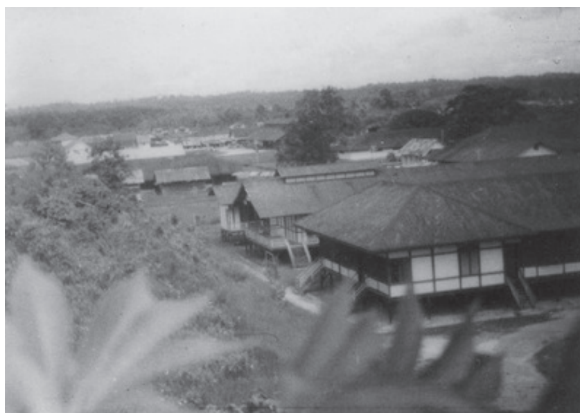
Gambar 2 Infrastruktur pertambangan tahun 1950-an berupa Pesanggrahan Bataafse Petroleum Maatschappij di Sangasanga