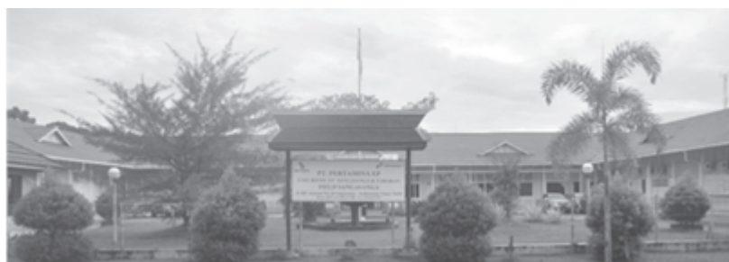
Gambar 1 Bekas kantor BPM dan sekarang menjadi kantor Pertamina UBEP (sumber: Dokumentasi Balai Arkeologi Banjarmasin)

Berdasarkan kenyataan tersebut, program pelestarian dan pemanfaatan SDA merupakan hal yang mendesak untuk dilakukan. Sementara itu, penelitian tentang pelestarian dan pemanfaatan bangunan purbakala dengan melibatkan masyarakatnya, belum banyak dilakukan. Widyawati dan Syahbana (2013) yang mengkaji keseriusan Pemerintah Kota Semarang dalam pelestarian kawasan kota lama, menghasilkan pengetahuan bahwa terdapat keseriusan dalam perlindungan kawasan cagar budaya yang ditandai dengan pendataan dan