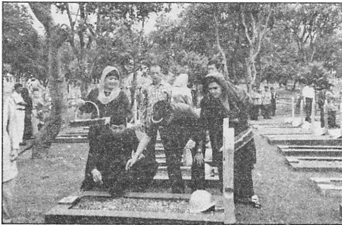
Gambar 2 : Para Anggota Paguyuban Sinoman sedang Tabur Bunga di Makam Pahlawan