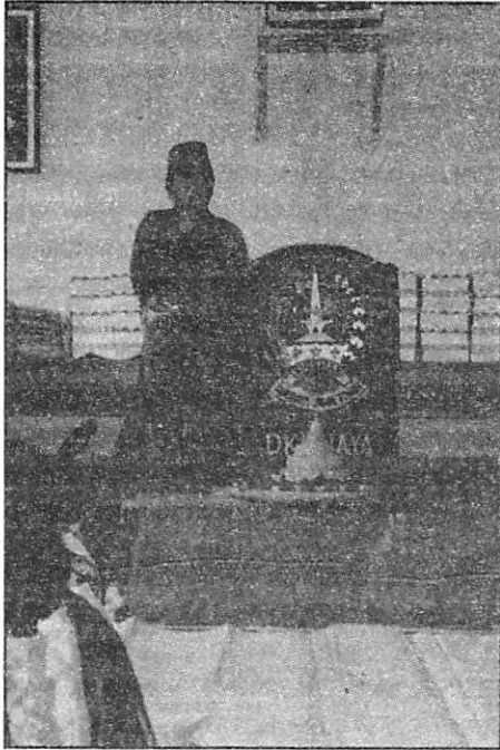
Gambar 1 : Ketua Paguyuban "Sinoman" memberikan Kata Sambutan dalam Rangka Hari Pahlawan