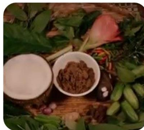
Bahan-Bahan Sambal Oen Peugaga

Sambal Oen Peugaga digemari masyarakat Aceh bukan hanya karena rasanya yang unik dan khas, melainkan juga karena penganan tradisional itu memiliki banyak khasiat bagi kesehatan. Khasiat dari pegagan dan daun-daun campuran yang ada di dalamnya dapat mengatasi berbagai macam penyakit, seperti darah manis (diabetes), kolesterol, dan masuk angin. Selain pegagan, daun-daun yang diracik dalam resep Sambal Oen Peugaga antara lain daun tapak lembar, kemangi, daun jambu, daun mangga, daun ubi-ubian, dan beberapa kelopak bunga seperti bunga kana merah. Pada zaman dahulu meliputi 44 daun tanaman, tetapi sekarang beberapa dari daun tersebut sudah susah didapatkan.