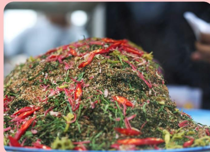
Sambal Oen Peugaga

Umumnya sambal identik dengan percobaian yang dihaluskan dengan cita rasa yang pedas dan segar, tetapi berbeda dengan sambal oen peugaga ini. Sambal yang identik dengan dedaunan dan rasa yang berbeda-beda menjadi menu andalan bagi masyarakat Aceh, apalagi ketika bulan Ramadan tiba, menjadi incaran masyarakat Aceh sebagai menu berbuka puasa. Sambal ini biasanya dijual oleh masyarakat pada sore hari di pinggir jalan bersama menu berbuka puasa lainnya.