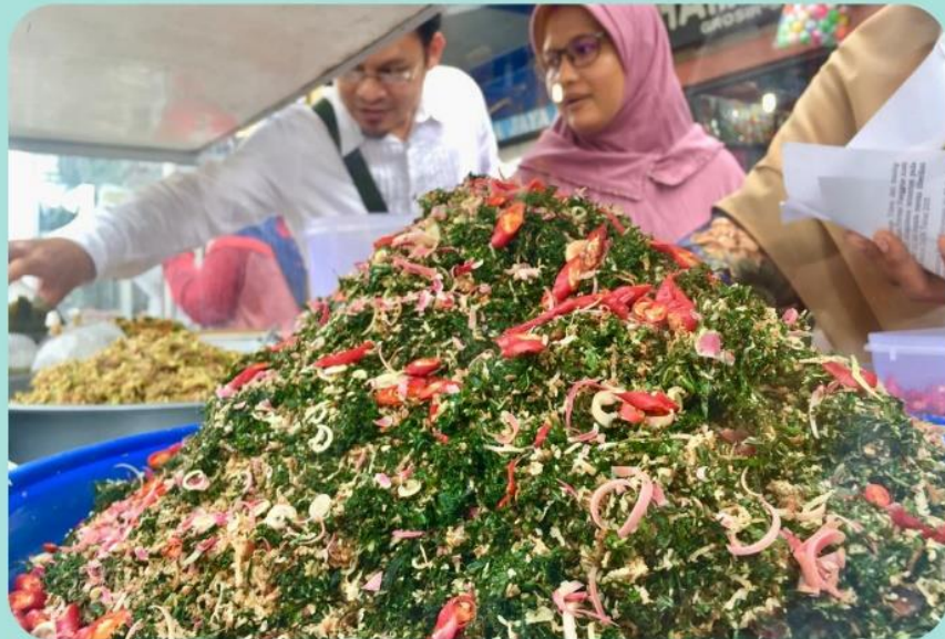
Penjaja Sambal Oen Peugaga

Cara membuat sambal ini tergolong mudah, karena semua bahannya hanya diiris halus, kecuali bahan bumbu yang sebagian harus ditumbuk kasar. Daun-daun yang ada digabung dan disusun rapi dalam bentuk bulatan dan dapat digenggam dengan baik, hal tersebut dilakukan untuk memudahkan dalam merajangnya. Setelah semua daun tadi dirajang maka selanjutnya irisan daun akan diuapkan sebentar sekitar 5 menit dan penguapan tersebut tidak boleh lama karena akan mengubah aroma dan rasa.