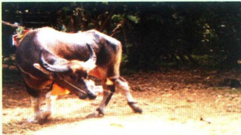
Gambar 8. Kerbau Jantan