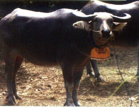
Gambar 19. Kerbau Jantan Untuk Makepung