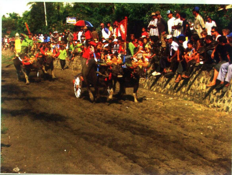
Gambar 6. Pegelaran Mekepong