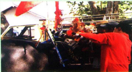
Gambar 15. Rumbing