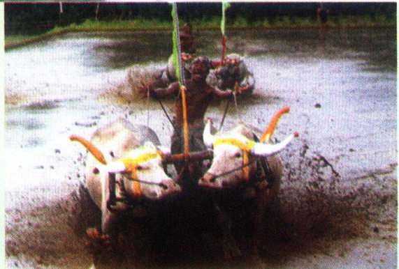
Gambar 4. Makepung Zaman Sekarang