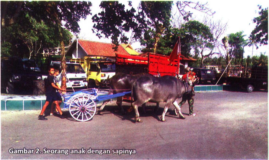
Gambar 2. Seorang anak dengan sapinya

Oleh Karena Kraton atau Puri adalah pusat birokrasi pemerintahan kerajaan tradisional, maka dapat dikatakan bahwa Jembrana dan Negara merupakan nama Kraton-kraton (Puri) yang dibangun pada permulaan abad XVII dan permulaan abad XIX adalah tipe kota-kota kerajaan yang ikut mengisi lembaran sejarah delapan kerajaan (asta negara) yang ada di Bali, di bawah Keresidenan Bali dan Lombok (Profil Kabupaten Jembrana, 2012, p. 12).