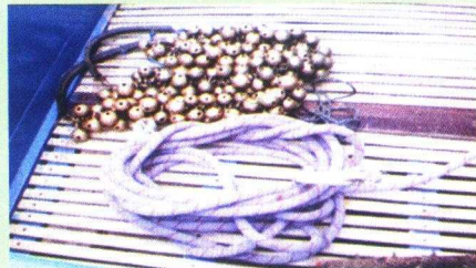
Gambar 14. Gongseng