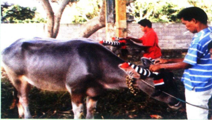
Gambar 16. Selongsong