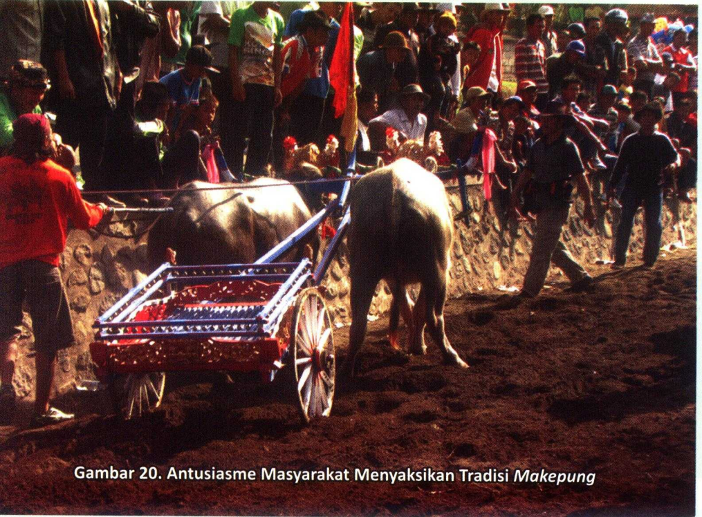
Gambar 20. Antusiasme Masyarakat Menyaksikan Tradisi Makepung