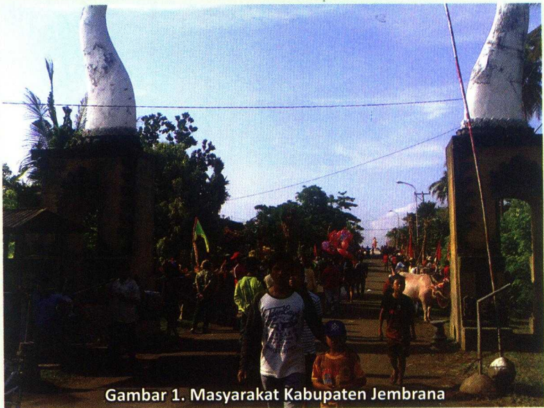
Gambar 1. Masyarakat Kabupaten Jembrana

Untuk dapat melihat lebih jauh tentang budaya makepung di Kabupaten Jembrana tentunya juga sangat terkait dengan sejarah berdirinya Kabupaten Jembrana itu sendiri. Berdasarkan bukti-bukti arkeologis dapat diinterpretasikan bahwa munculnya komunitas di Jembrana sejak 600 tahun yang lalu. Dari perspektif semiotik, asal-usul nama tempat atau kawasan mengacu nama-nama fauna dan flora. Munculnya nama Jembrana berasal dari kawasan hutan belantara (Jimbar-Wana) yang dihuni raja ular (Naga-Raja). Sifat-sifat mitologis dari penyebutan nama-nama tempat telah mentradisi melalui cerita turun-temurun di kalangan penduduk. Berdasarkan cerita rakyat dan tradisi lisan ( folklore ) yang muncul telah memberi inspirasi di kalangan pembangun lembaga kekuasaan tradisional (raja dan kerajaan) (Profil Kabupaten Jembrana, 2012, p. 4)