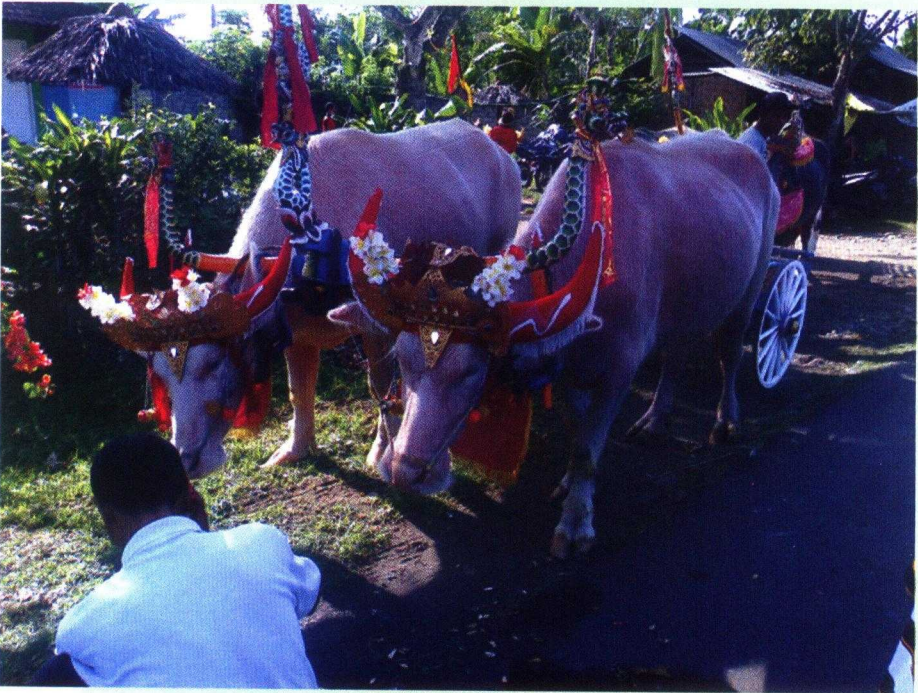
Gambar 5. Dua ekor kerbau albino untuk Mekepong

Seiring dengan langkah sang mentari, waktu pun berlalu. Setiap peserta lomba makepong telah menampilkan kebolehannya di arena perlombaan. Memenangkan perlombaan dan menjadi juara memang cita-cita dan harapan bagi setiap peserta lomba. Namun, menjadi juara bukanlah tujuan akhir dan segala-galanya. Bagi peserta, dapat tampil di arena perlombaan Makepong merupakan suatu kehormatan, prestise, dan sekaligus prestasi dalam mempertahankan tradisi budaya leluhur, sambil menghibur diri dan masyarakat penonton, menjalin solidaritas, berpacu dalam semangat kebersamaan, menjunjung tinggi sportivitas, di atas spirit pengakuan terhadap multikulturalisme.