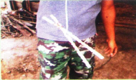
Gambar 13. Klengan