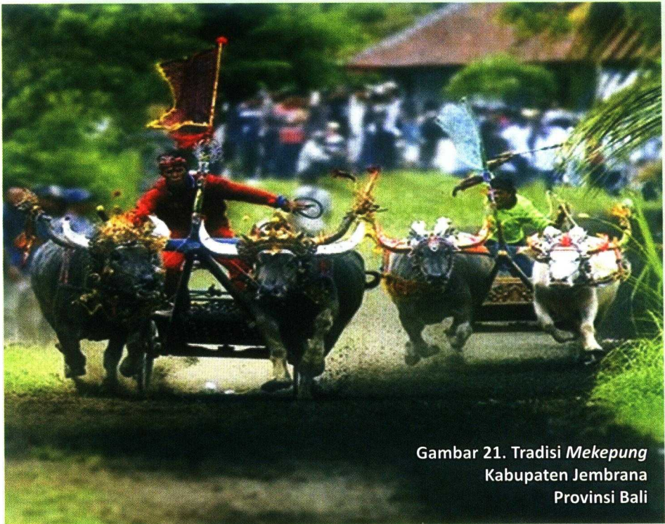
Gambar 21. Tradisi Mekepong Kabupaten Jembrana Provinsi Bali

dan menang pacuan kerbau. Penilaian yang menentukan kalah dan menangnya dalam pacuan kerbau adalah pada saat kerbau kembali dari putarannya dan di garis finis sudah siap 6 orang juri ( Saye Tumpeng ) yang menentukan kalah dan menangnya pasangan kerbau yang baru habis dipacu