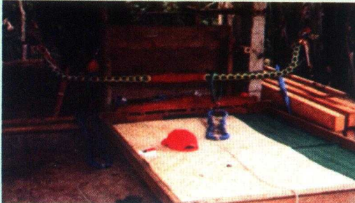
Gambar 11. Cagak