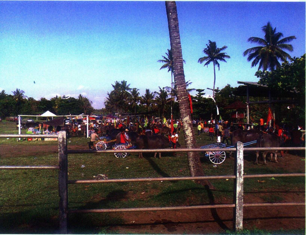
Gambar 7. Lokasi Tradisi Mekepung

yang membentang luas yang menjadi harapan masa depan para petani serta pegunungan yang menghijau dengan berbagai pepohonan produktif seolah-olah memanggil orang-orang agar berkunjung ke daerah ini menikmati tradisi lomba makepung dan menyaksikan kedamaian masyarakat Jembrana serta keindahan alamnya.