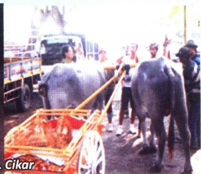
Gambar 9. Cikar