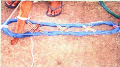
Gambar 12. Sambed