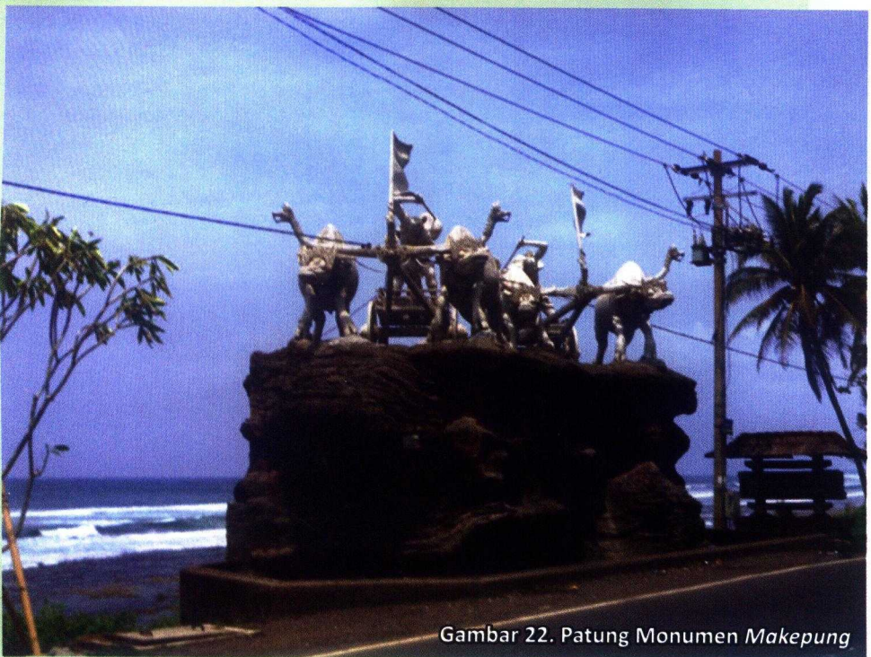
Gambar 22. Patung Monumen Makepung

diangkut mempergunakan kendaraan truk ke arena atau sirkuit Makepung sehari sebelum acara dimulai.