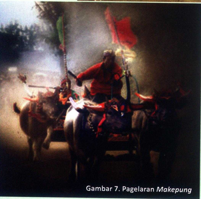
Gambar 7. Pagelaran Makepong