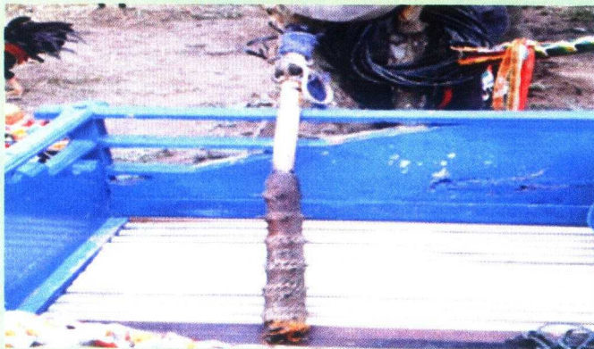
Gambar 17. Bongkol