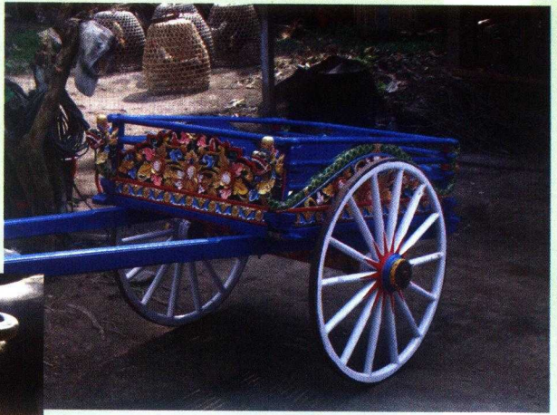
Gambar 18. Cikar