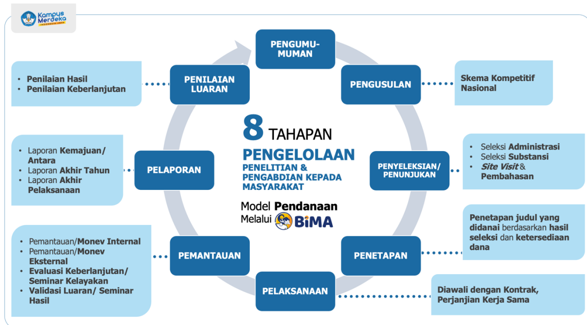
Gambar 1.1 Alur Kegiatan Pengelolaan Penelitian dan Pengabdian kepada Masyarakat

Dalam rangka pelaksanaan fasilitasi sekaligus fungsi pemantauan, evaluasi, dan pelaporan di bidang riset dan pengabdian kepada masyarakat, DRTPM dan DAPTIV memiliki alur kegiatan pengelolaan penelitian dan pengabdian kepada masyarakat seperti tercantum pada Gambar 1.1.