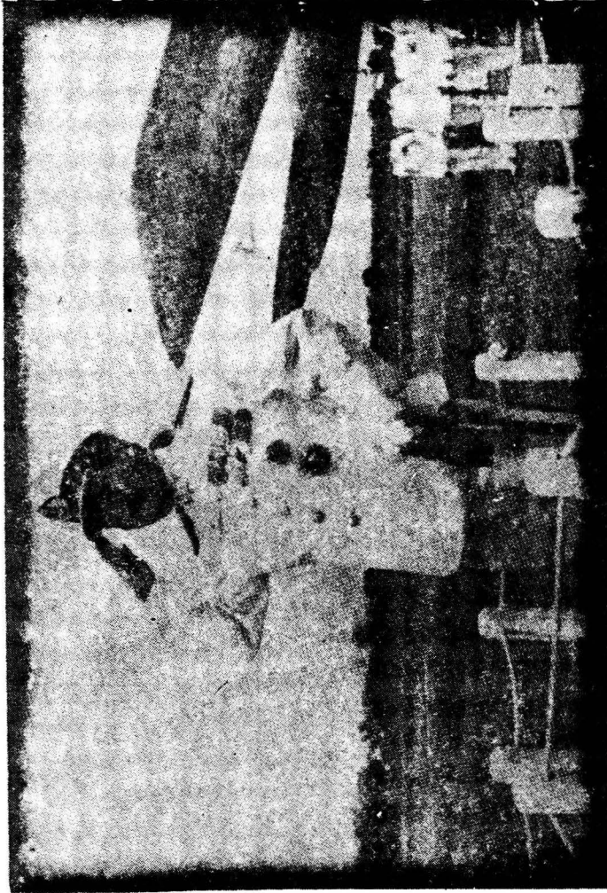
Laksamana R.E. Martadinata sedang menyambut defile barisan kehormatan di lapangan terbang Cochin.