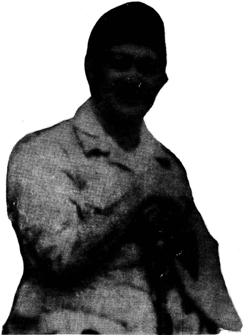
PAHLAWAN NASIONAL GUBERNUR R.T.M.A. SURYO.