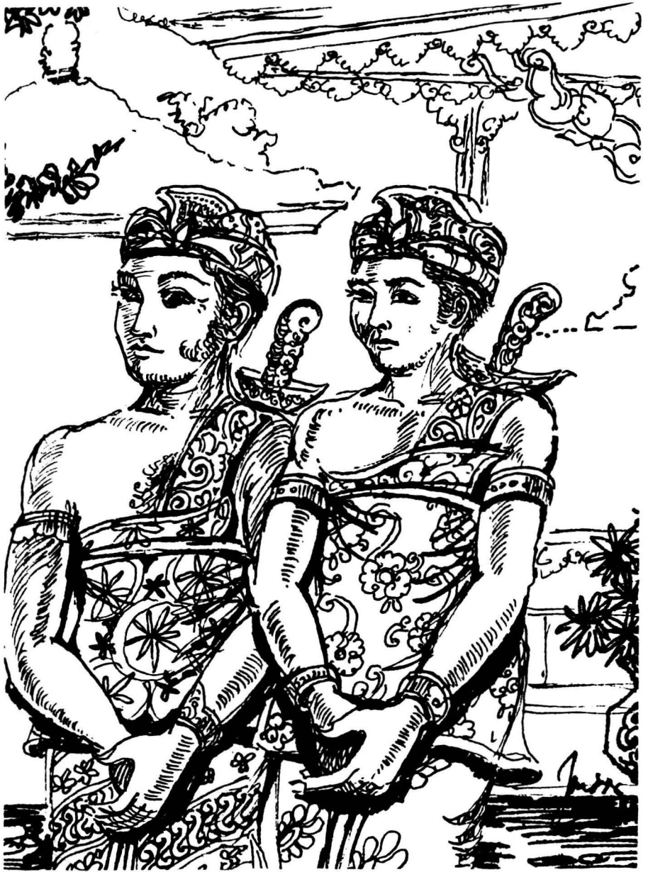
Raja Gegelang disertai raja Sri Brahma siap menghadap Sri Maharaja Hayam Wuruk.