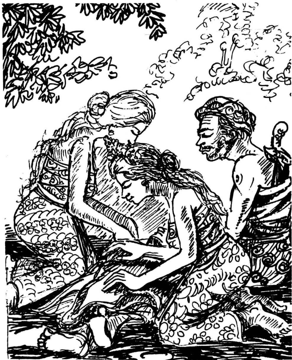
Permaisuri dan Ken Pitar menangisi raja yang telah gugur di medan laga.