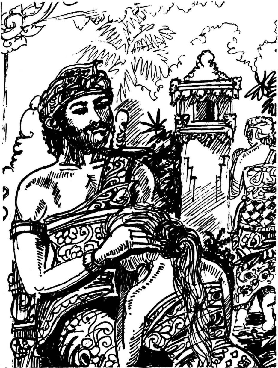
Putri: Sunda, sujud dihadapan ayahanda raja dan berjanji setia sehidup semati.