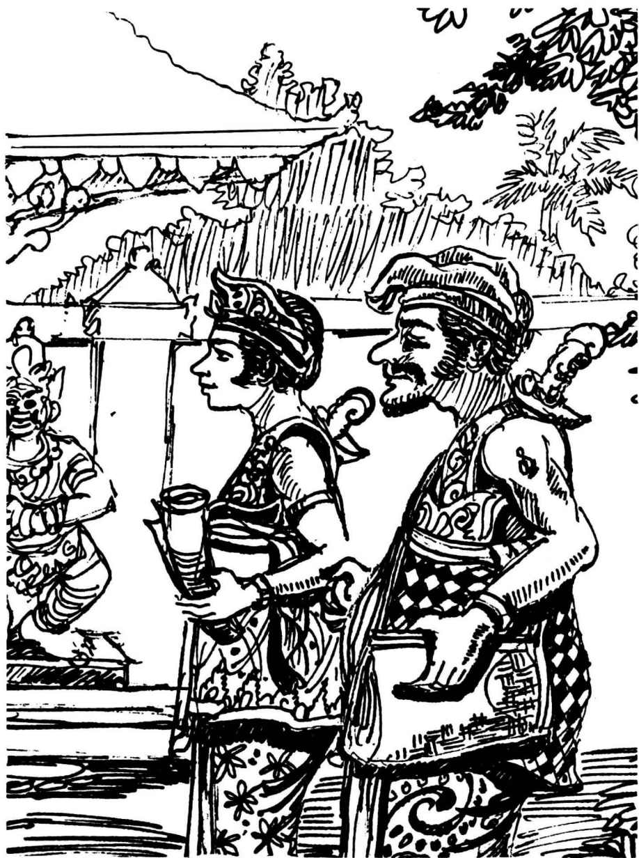
Patih Madu permisi dari istana dalam mempersiapkan keberangkatannya ke Majapahit.