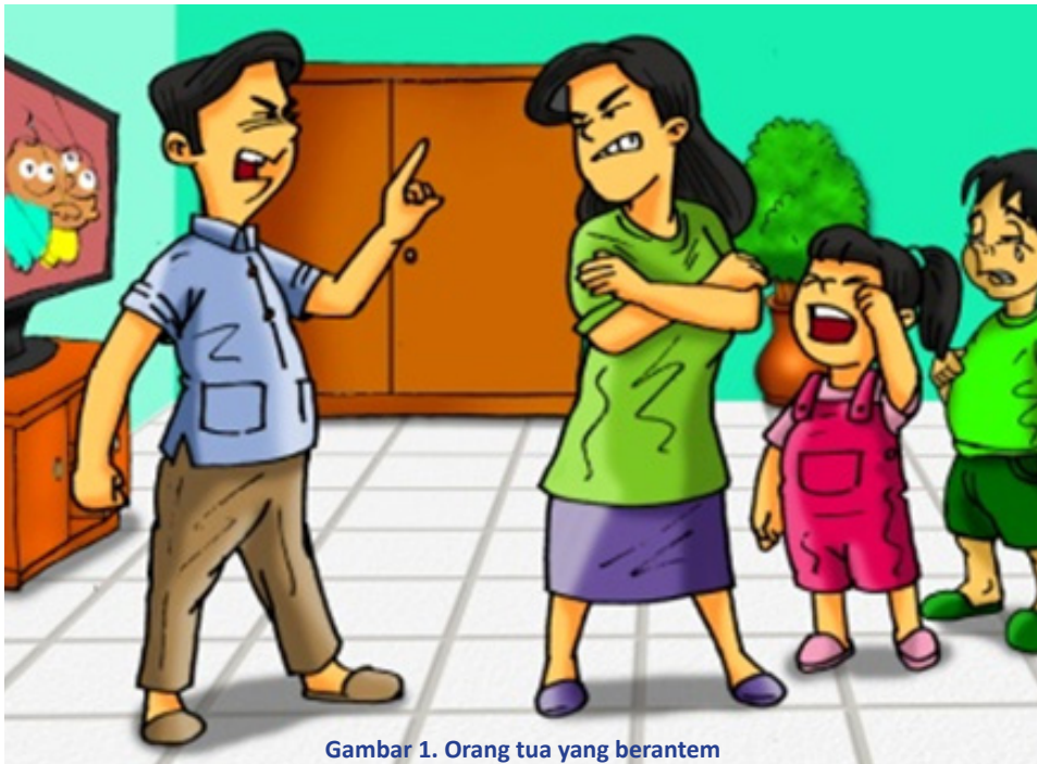
Gambar 1. Orang tua yang berantem

Hirup rukun dimasyarakat jeung hirup rukun di keluarga kudu bisa mere manfaat keur urang sorangan jeung keur batur, hirup rukun teh, urang kudu bisa, mikaasih, mikanyaah, silih ngajenan jeung mika.