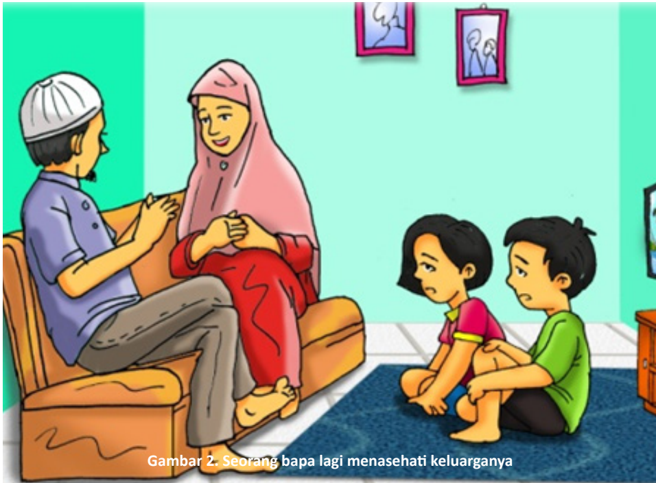
Gambar 2. Seorang bapa lagi menasehati keluarganya