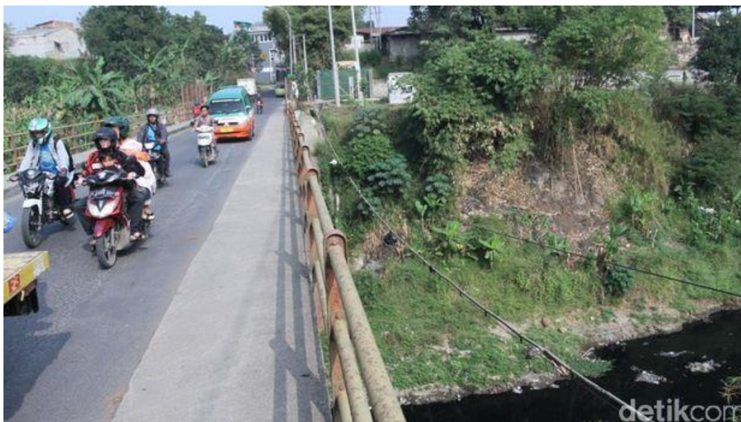
Bau busuk tercium saat melintas di atas Jembatan Citarum yang berada di Jalan Raya Kutawaringin-Soreang.

Kutawaringin saat ditemui di dekat jembatan. Uden mengungkapkan, sejumlah pabrik yang berdiri di aliran Sungai Citarum, kerap mengeluarkan limbahnya ke aliran sungai sehingga membuat airnya tercemar. "Ini sudah terjadi sejak lama. Setiap musim kemarau suka seperti ini," ujarnya.