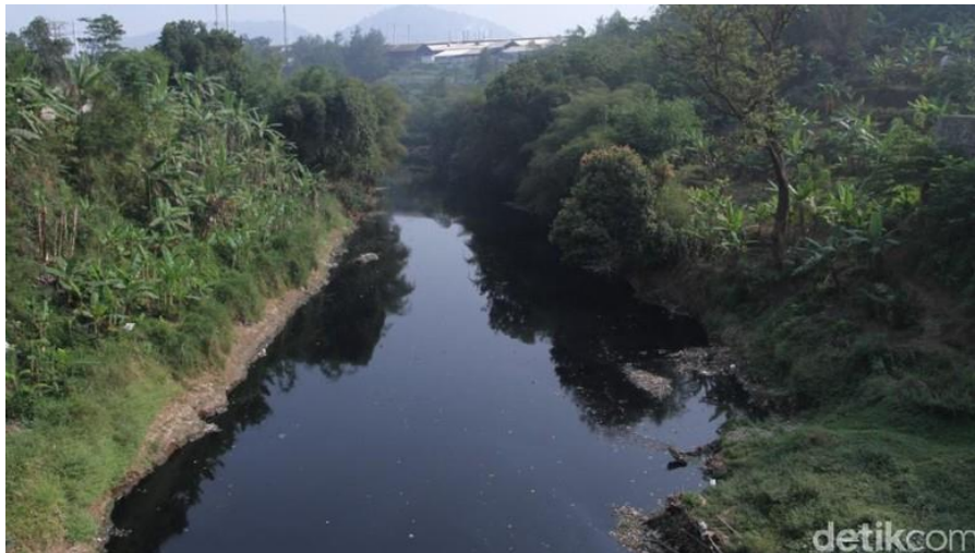
Air Sungai Citarum nampak hitam.

Kabupaten Bandung - Aliran Sungai Citarum berubah warna menjadi hitam pekat di musim kemarau. Air sungai tersebut mengeluarkan bau busuk sehingga dikeluhkan masyarakat.