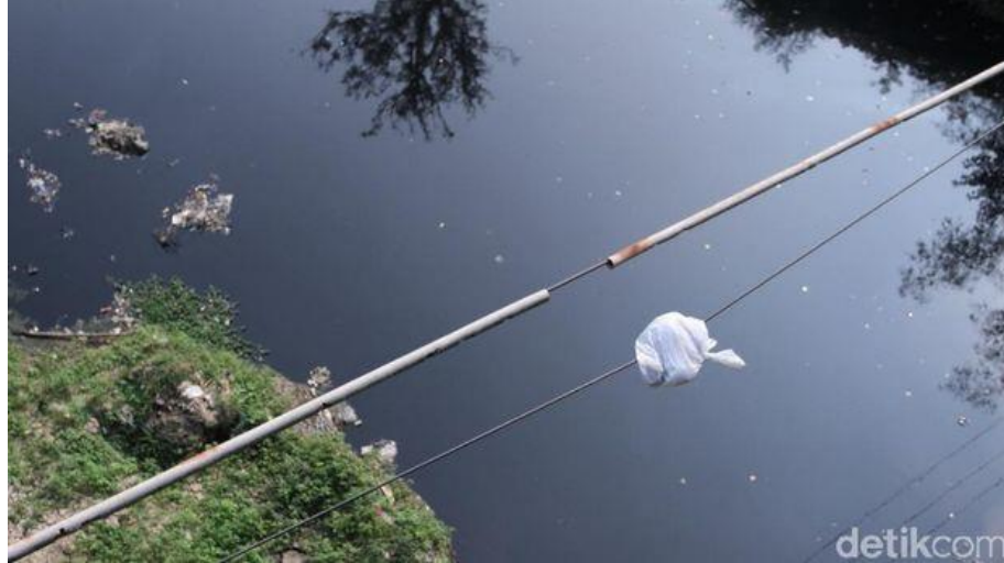
Air sungai tersebut mengeluarkan bau busuk sehingga dikeluhkan masyarakat.

Warga lainnya, Ujang (45) mengatakan, akibat perubahan warna sungai tersebut dan mengeluarkan bau busuk, banyak lalat hinggap ke pemukiman warga. "Banyak lalat, bau air nya tercium sampai ke pemukiman. Tidak nyaman, ya tapi gimana lagi," kata Ujang.