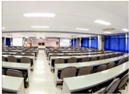
Aula I, Gedung Pancasila