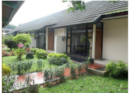
Asrama Ramayana (luar)