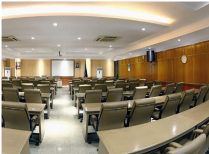
Aula II-A, Gedung Pancasila