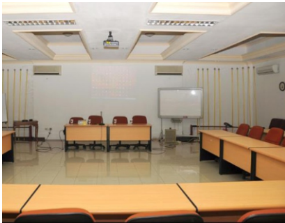
Ruang Sidang Fatahillah