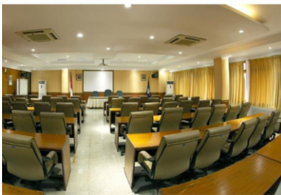
Aula II-B, Gedung Pancasila