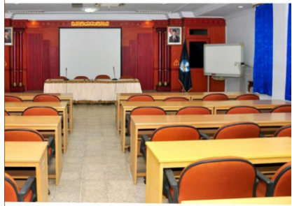
Aula III, Gedung Pancasila