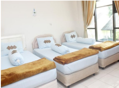
Asrama Ramayana (kamar)