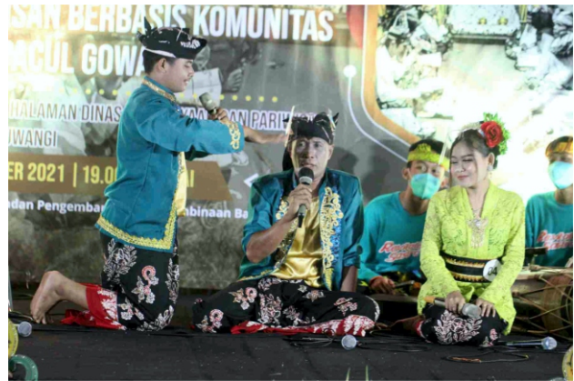
Peserta nomer penampilan 04 Gandrung Arum Cluring