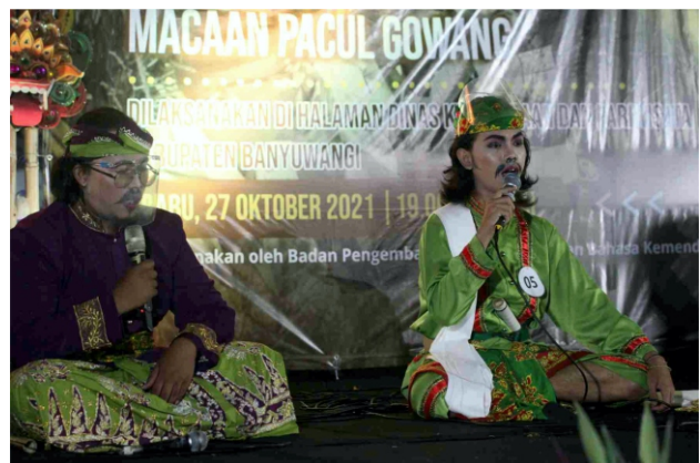
Peserta No Penampilan 05 Kakeen Gaya Pesinauan Kemiren