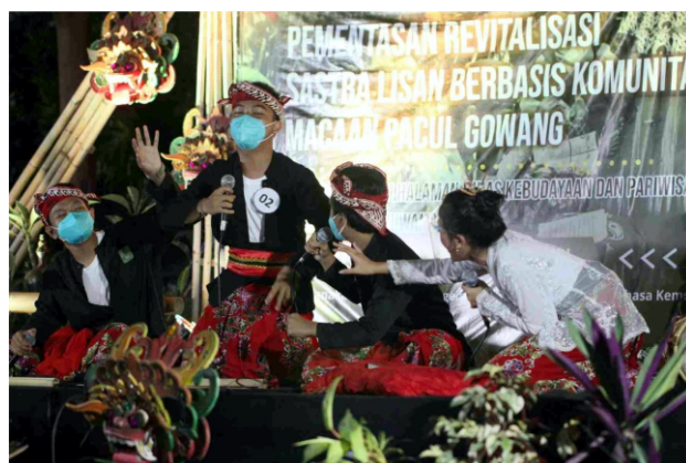
Peserta nomer penampilan 02 Spensaba Mileneal