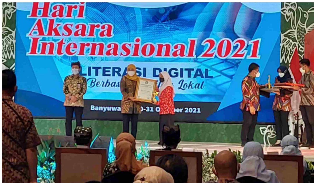
Putri nampa Penghargaan langsung diuwakaken ring Gubernur Jawa Timur.

B anyuwangi kepilih dadi tuan rumah, kanggo mengeti gebyar dina Aksara Internasional 2021 hang dianakaken Sabtu-Minggu, 30-31 Oktober 2021 sore. Setemene bain, kadhug miturut UNESCO, Hari Literasi Internasional utawa Hari Aksara Internasional/Sedunia (Hari Melek Huruf Internasional) diengeti saben tanggal 8 September. Dina kanggo mengeti, pentinge njaga 'melek huruf' kanggo saben menungsa, komunitas lan masyarakat.