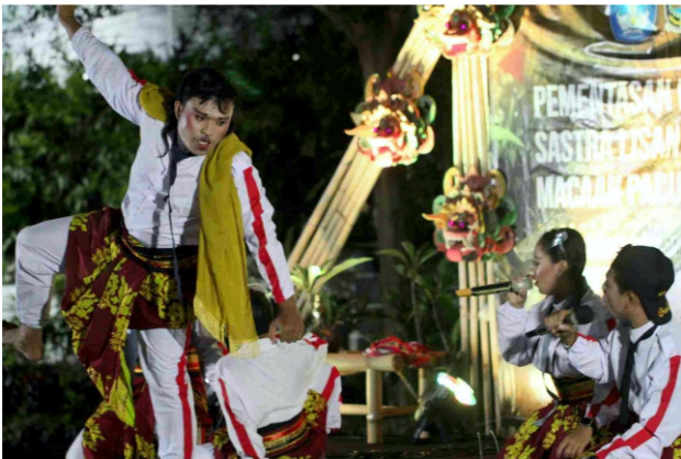
Peserta Nomer penampilan 03 Jiwa Etnik Blambangan

cilik-cilik lan paling enom merga kabeh magih sekolah ana ring SMPN 1 Banyuwangi. Naming grup iki cilik-cilik lobok litik masiya magih cilik naming sing keneng dienthengaken. Saksuwene manggung sing keneng diitung penonton kepok merga kaju nyang basanan lan laikan Banyuwangenan hang digawa. Pertunjukane katon seger merga laikan-laikan lan basanane gawenan anyar. Rasane kaya nak jenggirat maning Macaan Pacul Gowang iki merga ana lare-lare nom-noman hang kaya gediki wis bisa tampil ana ring Macaan Pacul Gowang. Iki sakteremene hang diarani grup mileneal temenan.