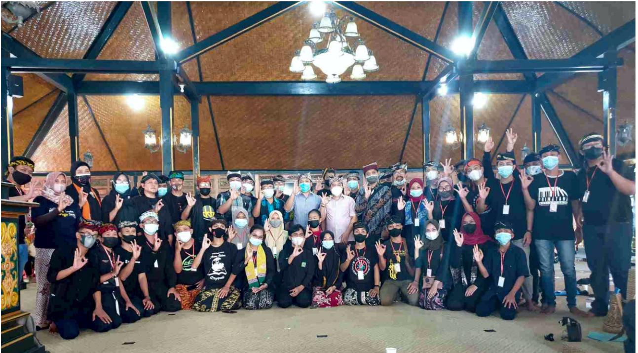
Peserta pelatihan foto bersama

Ring Pementasan iku, para juri sepakat hang ulih penghargaan Grup Terbaik 1 Jiwa Etnik Blambangan (JEB) , Terbaik 2 Gandrung Arum lan Terbaik 3 Spensaba (SMPN 1 Banyuwangi) .