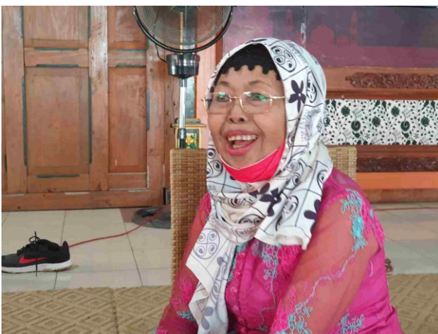
Gandrung Temu di Pelatihan