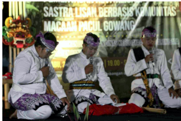
Peserta Nomer Penampilan 01 Cakrak ungal

Panitia Pementasan Revitalisasi terus milu lega serta wis ana pitung grup hang sanggup lan duwe kelayakan tampil ana ring pementasan tanggal 27 Oktober iku.