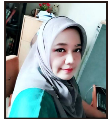
Redaksi: M.Oktavia Vidiyanti