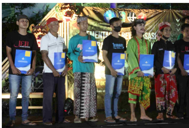
Penghargaan 7 Peserta Finalis Revitalisasi