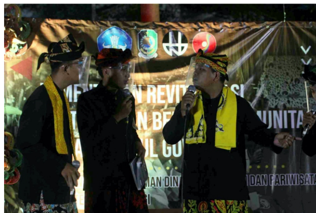
Peserta No penampilan 07

uga katon delese. Sing salah kadhung grup-grup teka Banyuwangi tengahan iki kuwat ana ring lagu lan logat gaya Rogojampi-an.