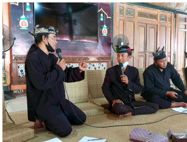
Instruktur Kenthus, Pwnyet dan CakWan sedang beraks

A li Kenthus, Slamet Penyet lan Cak Ikhwan milu dadi guru ring Pelatihan Macaan Pacul Gowang hang dianakaken telung dina sakat Jumat iki sampek Minggu ring Pelinggihan Dinas Kebudayaan dan Pariwisata.