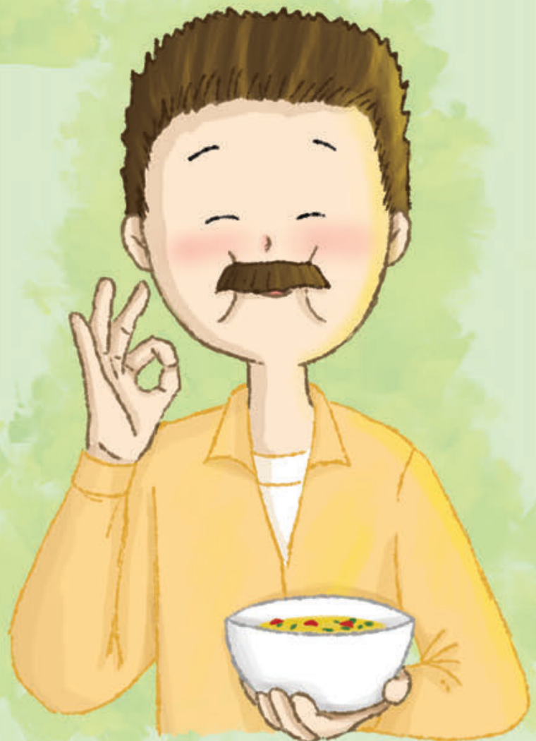
Soto Kudus enak