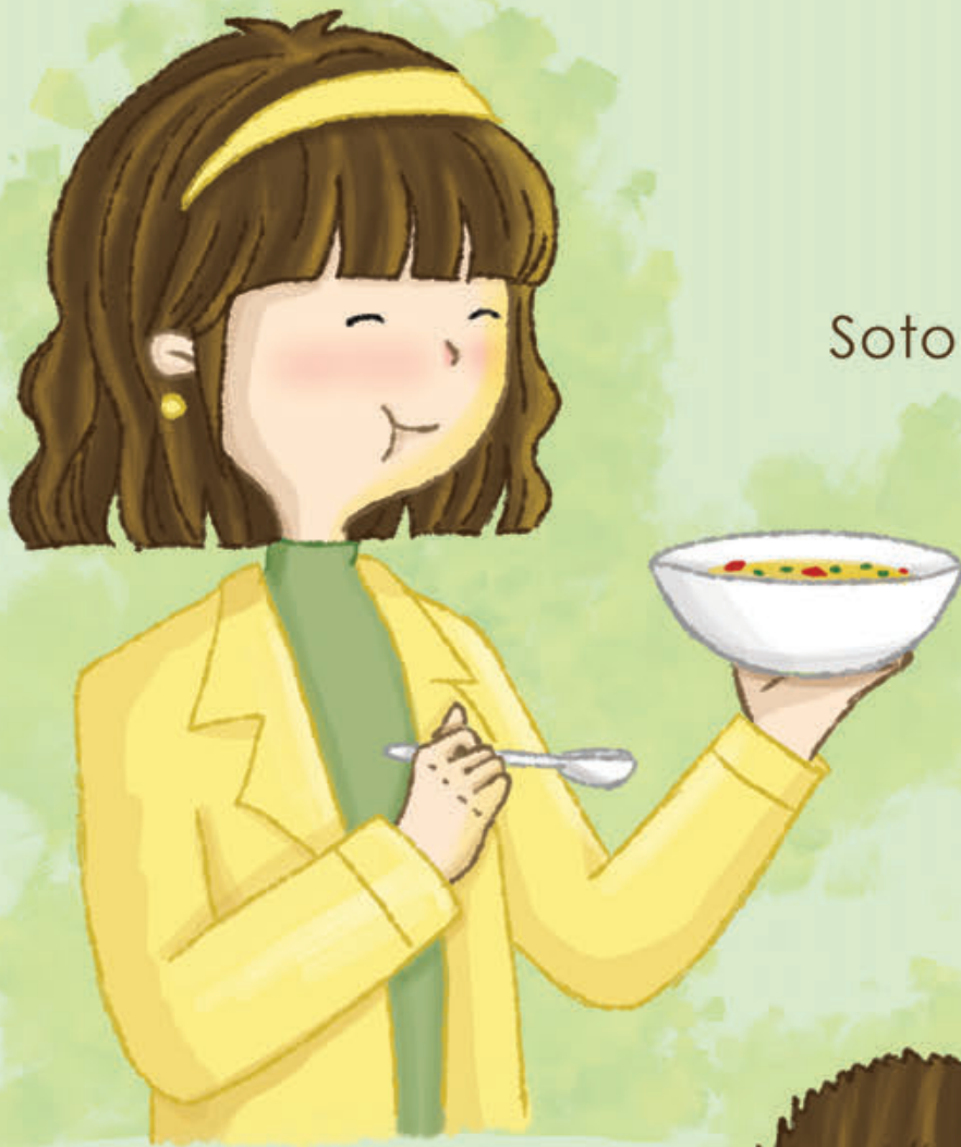
Soto Betawi enak