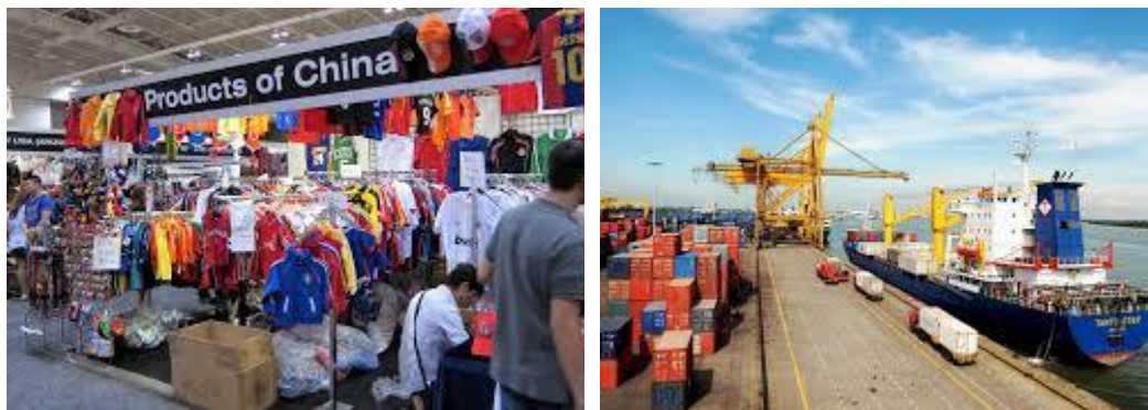
Gambar 1.1 Perdagangan Internasional

Senang berjumpa dengan kalian, anak-anak hebat Indonesia. Amati gambar berikut! Apakah Anda pernah melihat kegiatan berikut ini?