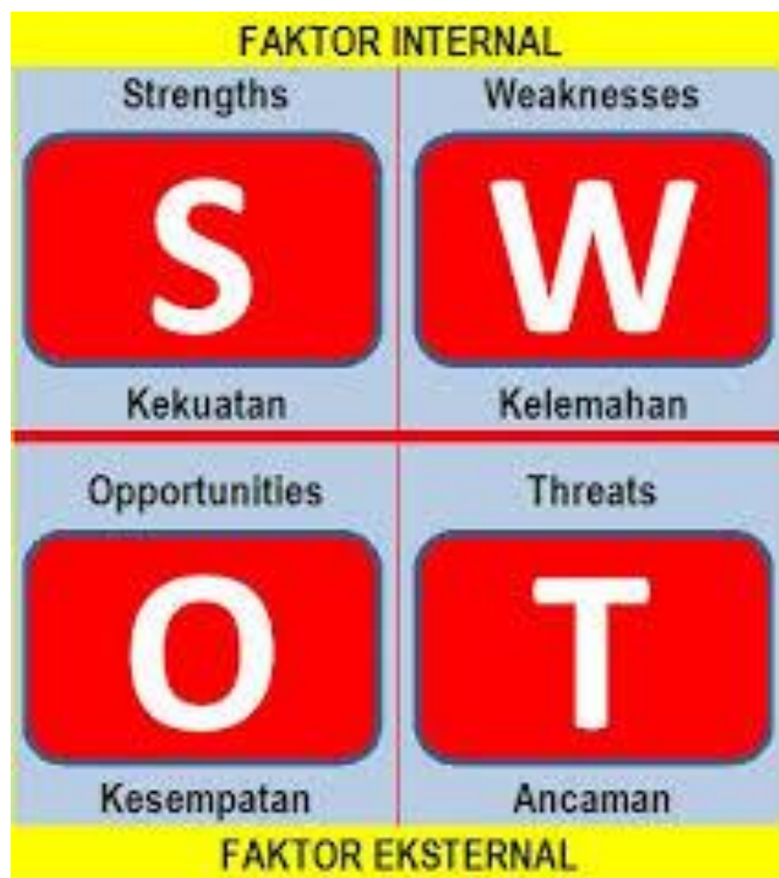
Gambar 2. Analisis SWOT,