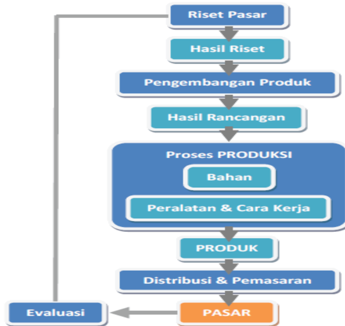
Gambar 1. riset pasar, researchGate https://www.mikirbae.com/2016/04/perencanaan-wirausaha-produk-fungsional.html

Disajikan contoh riset pasar yang dikembangkan dalam skema langkah-langkah perencanaan usaha.