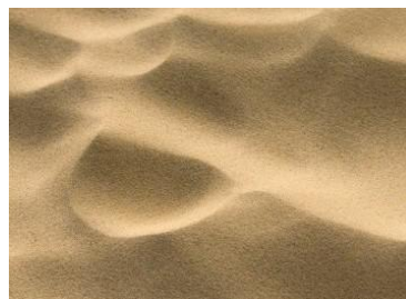
Gambar 4: Sand (Pasir)

Conundrum ini menggunakan permainan kata “ sand which ” yang berarti “pasir yang...” menjadi kata “ sandwich ” yang berarti roti lapis.