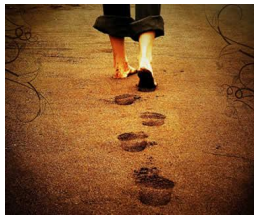
Gambar 3. Footsteps . (Langkah kaki)