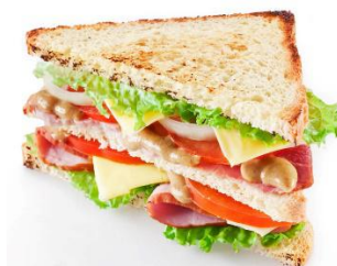
Gambar 5. Sandwhich (Roti lapis)