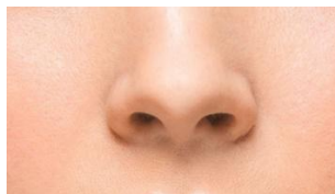
Gambar 1. Nose (Hidung)