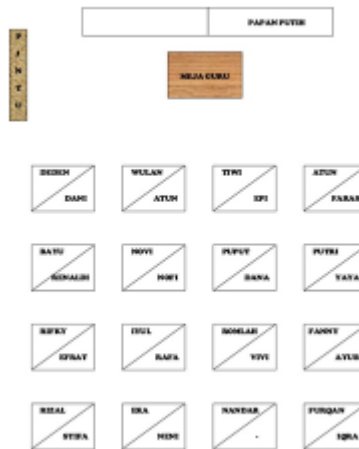
Denah tempat duduk kelas