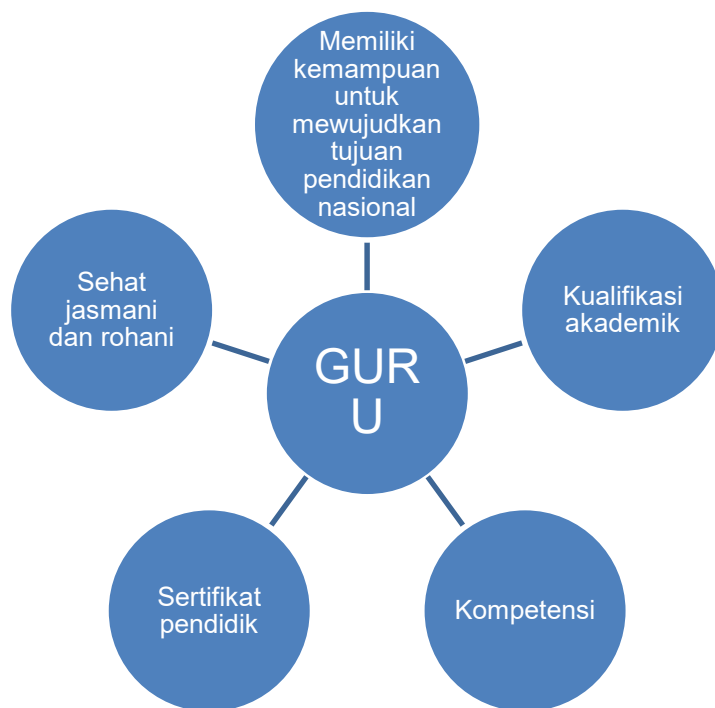
Gambar 1.1. Hal-Hal Yang Harus Dimiliki Guru

Pemerintah, pemerintah daerah dan penyelenggara pendidikan diwajibkan pula menyiapkan guru yang memenuhi berbagai persyaratan, seperti tergambar dalam ilustrasi berikut ini (Gambar 1.1.). Guru wajib memiliki kualifikasi akademik, kompetensi, sertifikat pendidik, sehat jasmani dan rohani, serta memiliki kemampuan untuk mewujudkan tujuan pendidikan nasional. Oleh karena itu, calon guru pun dituntut memiliki kualifikasi akademik, kompetensi, sertifikat pendidik, sehat jasmani dan rohani, serta memiliki kemampuan untuk mewujudkan tujuan pendidikan nasional (Gambar 1.1).