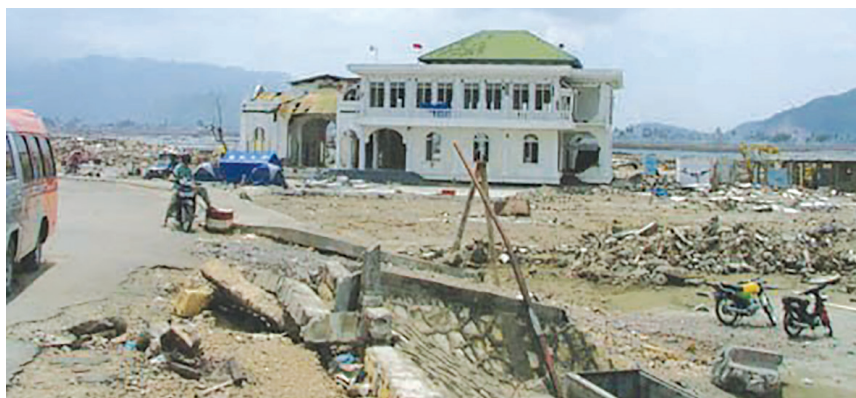
Kondisi Masjid Baiturrahim Ulee Lheue setelah diterjang bencana Tsunami.