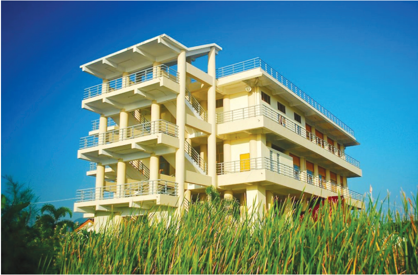
Tsunami Escape Building di Banda Aceh.