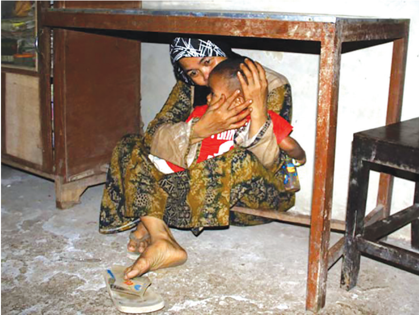
Simulasi penyelamatan saat terjadi bencana gempa

atau bukit-bukit di samping rumah untuk menghindari air. Jangan lupa juga membawa barang-barang yang diperlukan seperti bantal, kasur, selimut, dan pakaian.