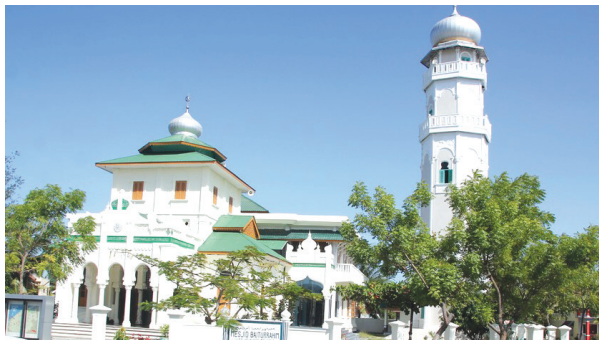
Kondisi Masjid Baiturrahim Ulee Lheue setelah 13 tahun bencana Tsunami.

ke Sabang dilayani dengan baik. Luar biasa kan? Mungkin jika tsunami tidak terjadi, Aceh tidak bisa berubah seperti ini. Inilah hikmahnya yang diterima masyarakat Aceh.