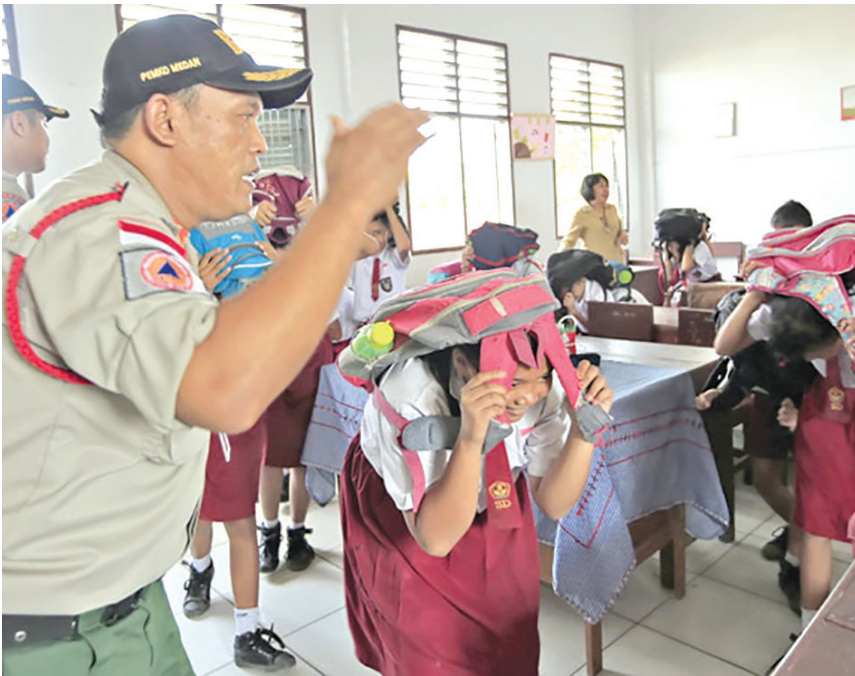
Simulasi penyelamatan saat terjadi Bencana gempa.

dapat dijumpai di tiga kawasan, yaitu Desa Lambung, Desa Deah Geulumpang, dan Desa Alue Deah Teungoh. Tiap-tiap gedung ini mampu menampung 1.000 orang. Di dalam gedung terdapat kamar mandi dan berbagai sarana keselamatan. Lebih hebatnya lagi, gedung keselamatan ini juga mempunyai tempat landasan helikopter di lantai atas dan juga memiliki sekolah bencana di kompleksnya. Teman-teman akan merasa aman dan nyaman ketika berada di dalamnya karena bangunan ini antigempa.