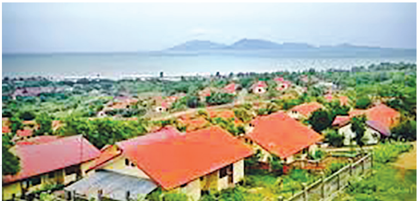
Rumah Persaudaraan Tiongkok-Indonesia. (foto: http://helloacehku.com )

Selain masjid, ada juga yang membangun rumah kepada warga Aceh. Rumah tersebut adalah salah satu bantuan yang dibangun oleh persaudaraan Indonesia dan Tiongkok. Perumahan tersebut lebih dikenal dengan nama Perumahan Jackie Chan karena yang membangunnya adalah artis terkenal asal China, Jackie Chan. Selain bangunan, masyarakat dunia juga membantu pembuatan jalan dan pembersihan puing-puing tsunami yang masih ada di Aceh. Teman-teman bisa bayangkan, kan, bagaimana persatuan di dunia ini untuk membantu saudaranya yang kesusahan. Kelak, hal-hal seperti itu sangat dibutuhkan oleh kita orang Indonesia untuk membantu orang lain dan membantu sesama.