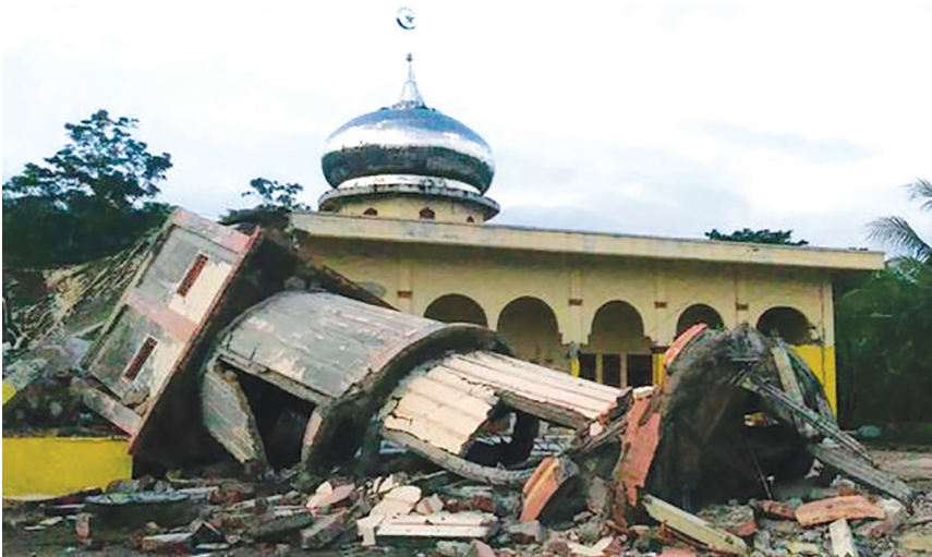
Kondisi bangunan setelah gempa di Pidie Jaya, Aceh.

Selain musibah dan bencana yang disebabkan oleh manusia, ada juga bencana yang terjadi dengan sendirinya tanpa campur tangan manusia. Di Aceh dan Indonesia pada umumnya juga pernah merasakannya misalnya gunung meletus, tsunami, dan air pasang. Meletusnya gunung seperti pernah terjadi di Sinabung beberapa waktu yang lalu tidak dapat dihindari sehingga kita hanya bisa waspada dan menghindari. Teman-teman juga pernah mendengar air pasang yang menyebabkan air laut naik ke permukaan, itu juga tidak dapat dilakukan oleh manusia. Yang paling besar adalah kejadian tsunami yang terjadi di Aceh pada tahun 2004.