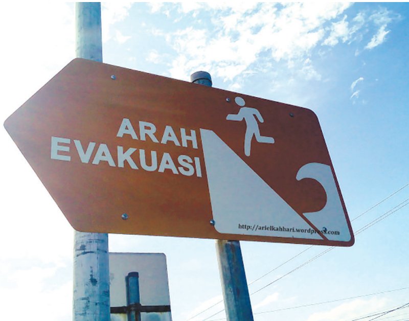
Rambu arah evakuasi bencana.

Dengan adanya peringatan itu, masyarakat bisa bersiap-siap untuk menyelamatkan diri dari bencana. Sirine tersebut sudah dites pada tanggal 26 April 2017 yang bertepatan dengan Hari Kesiapsiagaan Bencana (HKB) dan berjalan dengan lancar. Masyarakat juga diarahkan untuk mencari jalur aman untuk melarikan diri dari bencana air laut atau tsunami. Pemerintah Aceh juga telah memberikan rambu arah evakuasi yang bertujuan untuk membantu masyarakat memilih jalur yang aman untuk menyelamatkan diri.