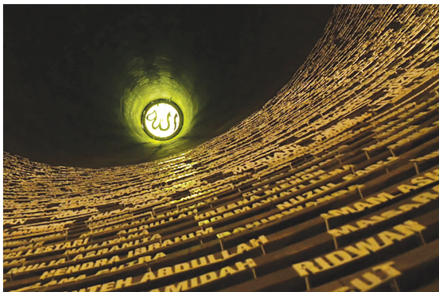
Sumur Doa di dalam Museum Tsunami.