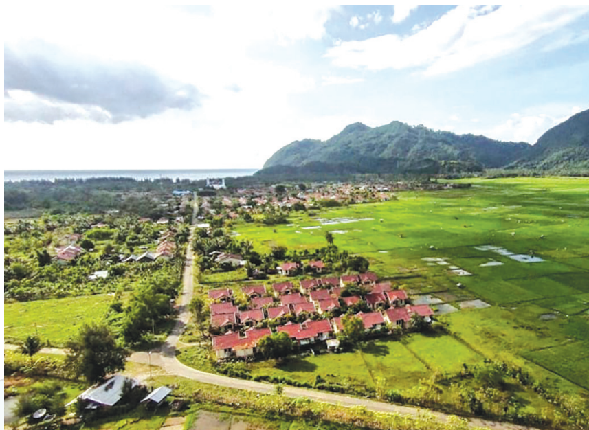
Kondisi Lampuuk setelah 13 tahun bencana Tsunami.

pohon cemara yang ditanam dan sawah-sawah yang menghijau membuat Lampuuk sangat indah. Sekarang, Lampuuk sudah berbeda sekali. Rumah-rumah bantuan Turki dengan atap merah berjejer sepanjang jalan menuju pantai. Teman-teman juga bisa menginap di rumah itu dengan paket wisata yang ditawarkan oleh masyarakat. Di rumah-rumah masyarakat tersebut, teman-teman dan keluarga bisa menginap dan merasakan makanan-makanan khas Aceh mulai dari kuah pliek , keumamah , dan timphan . Wow, lezat sekali.