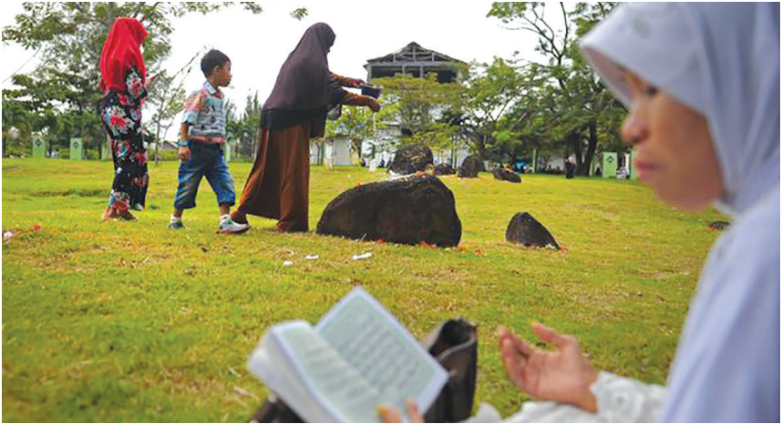
Masyarakat bertakziah di kuburan massal Ulee Lheue. (foto: https://www.liputan6.com )

sehingga dijadikan monumen peringatan bencana tsunami di Banda Aceh. Monumen tersebut ada yang dibangun oleh manusia dan ada yang terjadi dengan sendirinya akibat dari bencana tsunami. Berikut adalah monumen sisa tsunami tersebut yang teman-teman harus ketahui.