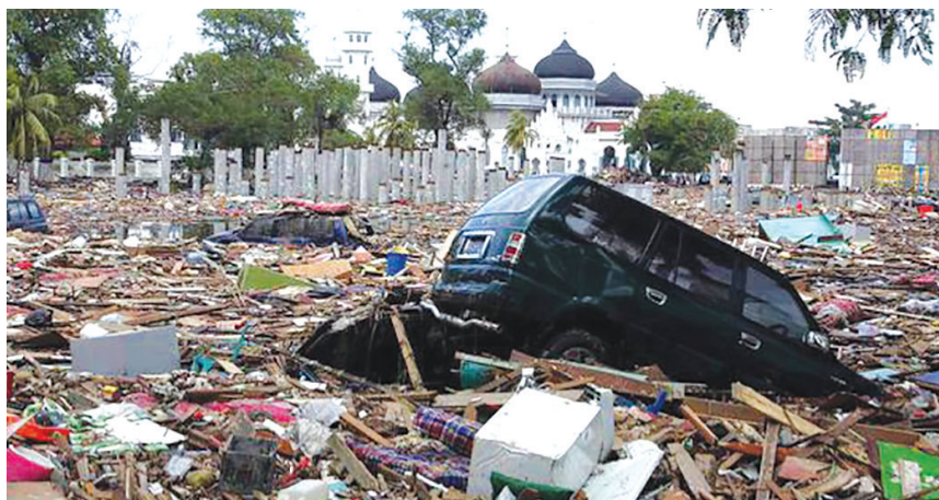
Kondisi Banda Aceh setelah diterjang bencana tsunami.

lumpur di mana-mana. Semua orang panik karena musibah tsunami. Orang tua kami di Aceh saat itu kesusahan untuk mencari air bersih karena semua sumber air tercemar dengan lumpur. Bantuan dari PMI dan masyarakat Indonesialah yang membuat Banda Aceh bisa menjadi seperti sekarang.