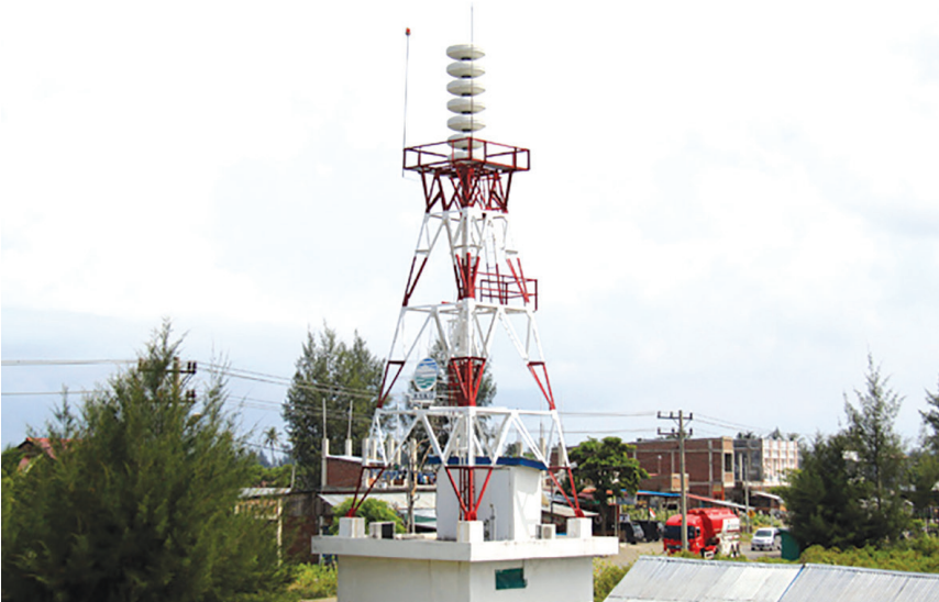
Sirine peringatan Tsunami.