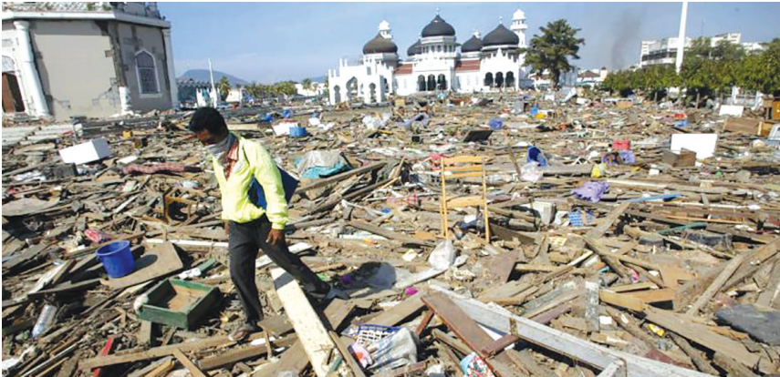
Kondisi Aceh setelah Tsunami.

Seketika, anak-anak dan orang tua yang memungut ikan tadi langsung berlarian ke arah jalanan untuk mencari perlindungan. Air yang melaju sangat kencang menyapu semua yang ada di pantai. Pohon-pohon, rumah, dan orang-orang yang berlarian semua dihempas oleh air laut dan membuat Aceh luluh-lantak.