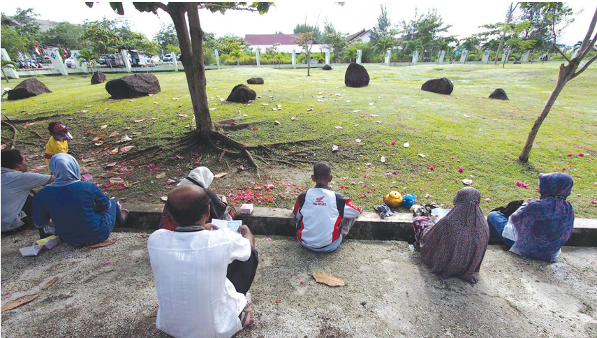
Warga ziarah di pemakaman massal Ulee Lheue, Kota Banda Aceh.

sakit. Teman-teman bisa membayangkan bagaimana sedihnya aku yang tidak menjumpai keluarga dekatku karena bencana tsunami itu. Paman dan kakekku sampai sekarang tidak ditemukan. Mungkin mereka sudah tenang bersama Allah di Surga.