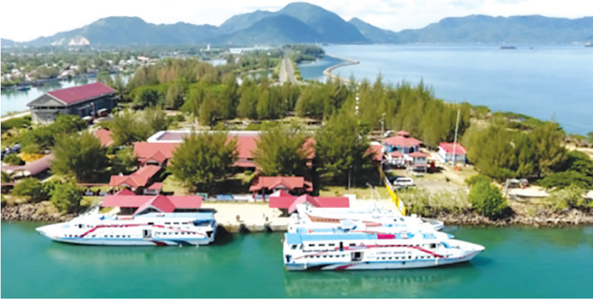
Kondisi pelabuhan Ulee Lheue setelah 13 tahun bencana Tsunami.