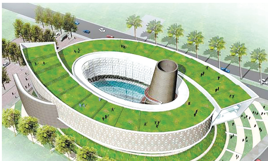
Rancangan Museum Tsunami.

hendak berlayar. Teman-teman yang belum pernah pergi ke Aceh pasti bermimpi untuk bisa ke tempat ini. Museum Tsunami terletak di sebelah kiri Lapangan Blang Padang yang merupakan tempat diletakkan pesawat RI pertama dan berjarak sekitar satu kilometer dari Masjid Raya Baiturrahman, Banda Aceh.