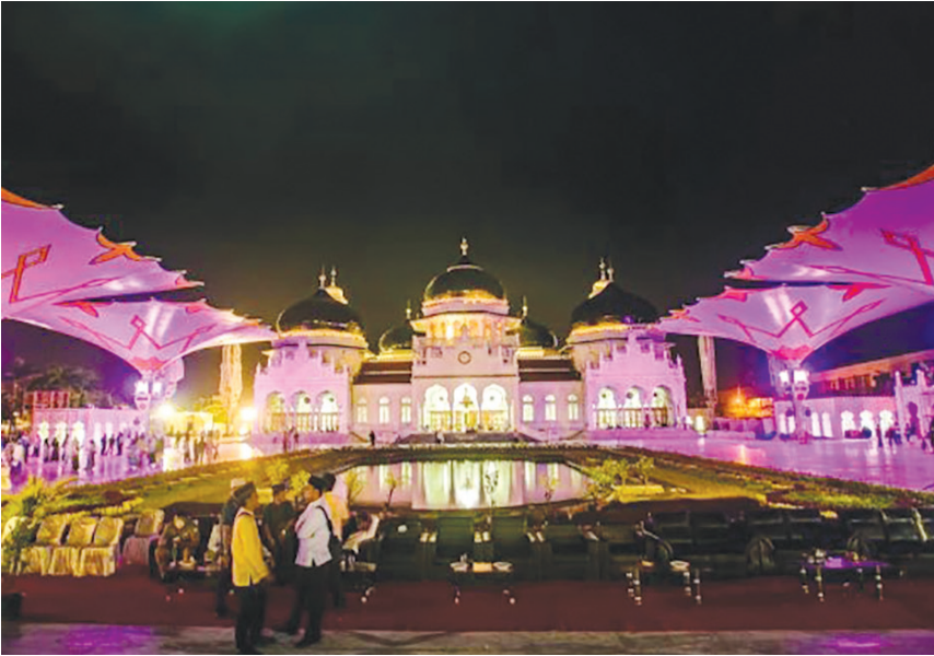
Kondisi Banda Aceh tahun 2018. (foto: https://www.google.co.id/mirajnews.baiturrahman )

Banda Aceh sekarang sudah sangat indah. Masjid Raya Baiturrahman sudah dibangun kembali. Banyak payung yang dibangun sehingga ketika malam hari, masjid Raya Baiturrahman menampilkan lampu warna-warni yang indah sekali. Payung itu menyerupai payung di masjid di Madinah. Di samping masjid, ada taman Bustanus Salatin yang dibuat untuk taman bermain anak-anak dan tempat pertunjukan seni. Sekarang, tidak ada lagi puing-puing tsunami, jalanan tidak macet, semua transportasi ada.