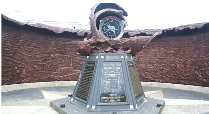
Jam PLTD Apung.

PLTD Apung ini adalah sebuah pembangkit listrik dengan berat 2.600 ton yang ada di tengah laut dan dibawa oleh tsunami hingga ke tengah kota Banda Aceh. Teman-teman pasti heran kenapa bisa di bawa sejauh itu. Itu adalah keajaiban, tidak ada yang sanggup memindahkannya kembali ke lautan hingga sekarang. Oleh karena itu, PLTD dijadikan sebuah monumen. PLTD Apung ini banyak sekali dikunjungi wisatawan, teman-teman juga harus datang sekali ke PLTD ini.