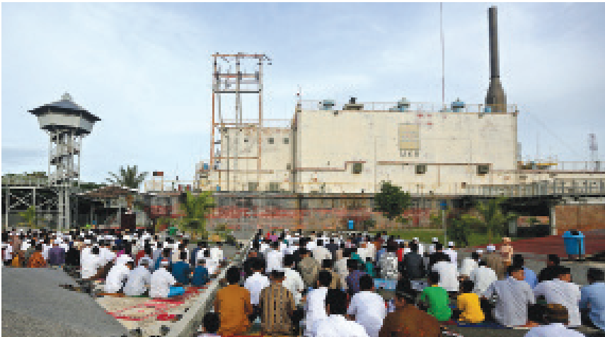
Warga melaksanakan salat Idul Fitri di kompleks situs bencana tsunami Kapal PLTD Apung, Punge Blang Cut, Banda Aceh.

Teman-teman, aku sudah berkunjung ke beberapa monumen bencana tsunami yang ada di Banda Aceh. Salah satunya adalah PLTD Apung yang sangat besar dan berat.