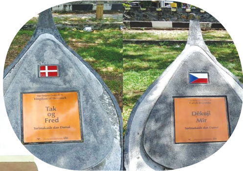
Aceh Thanks to The World yang terletak di Blang Padang, Banda Aceh.

sana terdapat semua bendera negara yang membantu Aceh untuk bangkit setelah tsunami. Teman-teman dapat melihat negara-negara itu sambil olahraga di lapangan Blang Padang bersama keluarga.