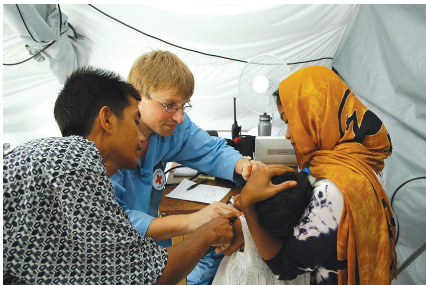
Masyarakat asing membantu pengobatan korban Tsunami Aceh.