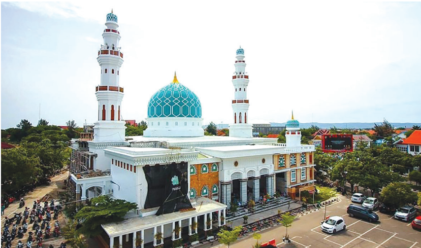
Masjid Agung Al-Makmur (Oman) Banda Aceh.

terulang, masyarakat sudah bisa menyelamatkan diri dari ganasnya bencana alam. Banyak sekali bangunan-bangunan yang dibangun oleh bantuan dari masyarakat luar negeri, ada dari Amerika, Jepang, Arab Saudi, Korea, Inggris, Cina, Thailand, Singapura, Malaysia dan negara-negara lainnya. Bangunan yang dibangun misalnya sekolah, tempat ibadah, dan tempat-tempat pengungsian. Ada juga yang membangun rumah untuk penduduk dan lainnya. Rumah ibadah yang ada dalam foto itu adalah Masjid Agung Al Makmur di Banda Aceh yang dikenal dengan sebutan Masjid Oman karena dibangun kembali oleh Sultan Qabus Bin Said dari negara Kesultanan Oman setelah tsunami.