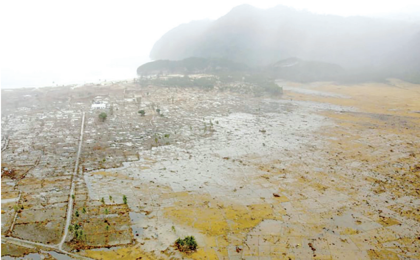
Kondisi Lampuuk sesaat setelah Tsunami.

Masjid Rahmattullah yang tersisa dan menjadi suatu keajaiban tsunami di Lampuuk. Bayangkan saja teman-teman, semua rumah hancur, tetapi masjid Rahmatullah masih kukuh berdiri. Ketika kita melihat foto-foto yang dipajang di kawasan Lampuuk, teman-teman pasti akan melihat kondisi wilayah Lampuuk pada saat itu.