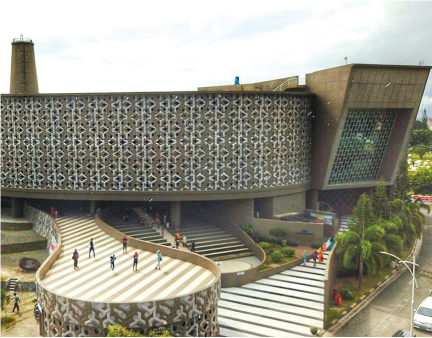
Museum tsunami yang berada di Banda Aceh, tampak dari depan.

Pada saat musibah tsunami itu, banyak sekali kejadian-kejadian ajaib yang terjadi. Ada sebuah