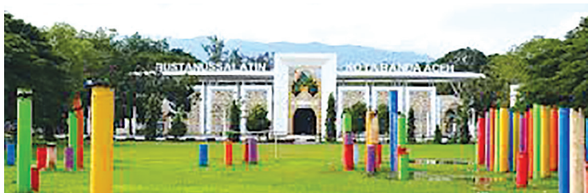
Taman Bustanus Salatin

Banda Aceh sudah berubah. Jadi, mulai sekarang teman-teman sudah bisa menabung untuk ke Aceh. Aku tunggu ya. Sampai jumpa di Aceh, ajak keluarga dan sahabatmu. Saleum Meusyedara.