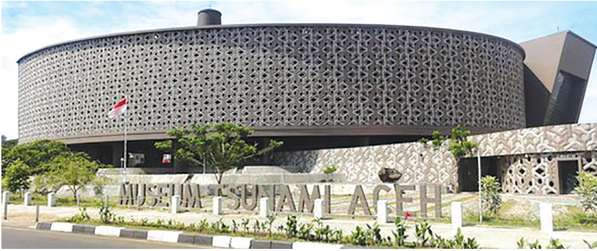
Museum Tsunami.