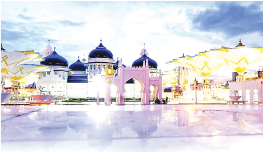
Masjid Raya Baiturrahman setelah direnovasi.

oleh masyarakatnya. Di sini juga ada salah satu masjid terbaik di Asia Tenggara dan memiliki payung seperti di Masjid Nabawi, Medinah.