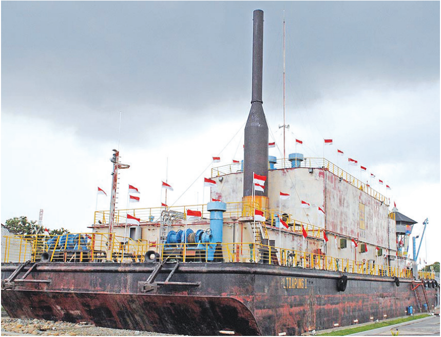
PLTD Apung yang terletak di Punge Blang Cut, Banda Aceh.

Sekarang, jika teman-teman ke Aceh, mungkin tidak akan percaya bahwa di Aceh pernah terjadi bencana sedahsyat itu. Kondisi Banda Aceh sekarang sudah sangat bagus. Hal itu karena masyarakat Indonesia dan mancanegara bersatu untuk membantu penderitaan masyarakat Aceh dengan berbagai kegiatan dan sumbangan sehingga Aceh sekarang sudah menjadi lebih baik dari sebelumnya. Sebagai ucapan terima kasih, masyarakat Aceh membuat suatu monumen di Blang Padang dengan teman Aceh Thanks to The World . Di