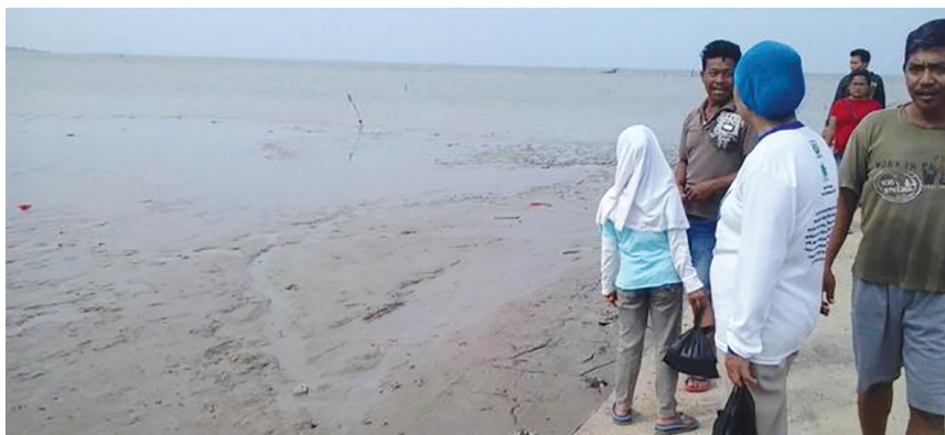
Air Laut Surut

Tsunami terjadi pada tanggal 26 Desember 2004 membuat panik semua masyarakat Aceh termasuk anak-anak dan orang tua kita. Sebelum terjadinya tsunami, pada pukul 07.55 WIB tepatnya hari Minggu 26 Desember 2004 terjadi gempa yang mengguncang tanah dan pohon-pohon. Semua orang ketakutan karena belum pernah merasakan gempa seperti itu. Begitu juga kondisi gempa kedua di Pidie Jaya, Aceh tahun 2016.