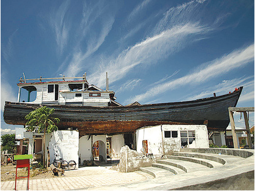
Perahu nelayan terdampar di atas rumah warga akibat bencana Tsunami.

Kecamatan Kuta Alam. Sekarang, desa ini adalah desa yang sangat dekat dengan laut karena rumah-rumah lain di pinggir pantai sudah hancur oleh tsunami.