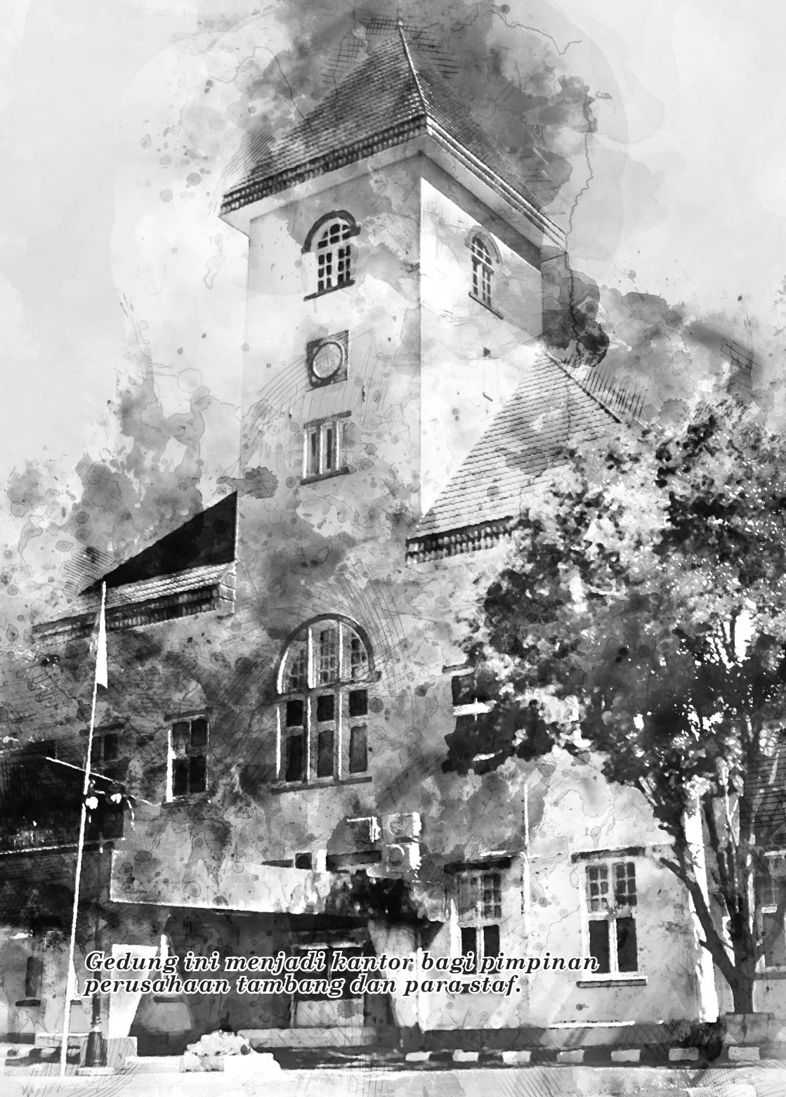
Gedung ini menjadi kantor bagi pimpinan perusahaan tambang dan para staf.