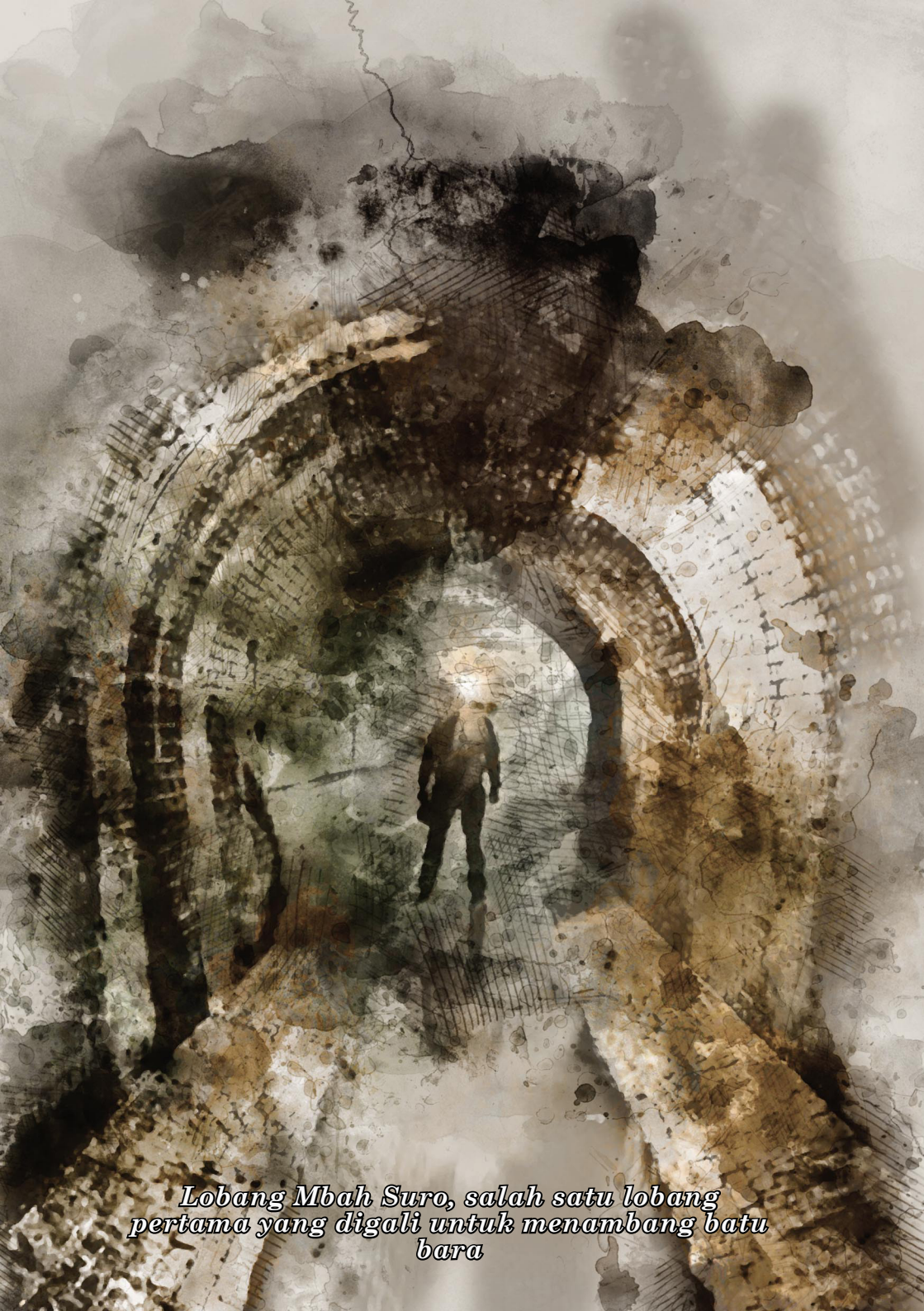
Lobang Mbah Suro, salah satu lobang pertama yang digali untuk menambang batu bara